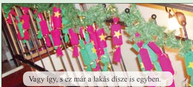
Vagy így, s ez már a lakás díszje is egyben.