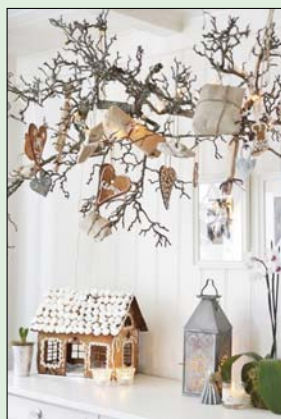
A natúr színekkel is el tudjuk érni az ünnepi hangulatot.