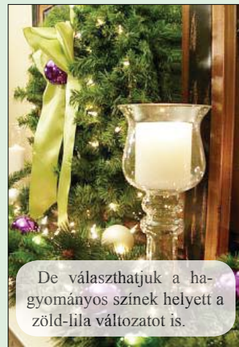
De választhatjuk a hagyományos színek helyett a zöld-lila változatot is.