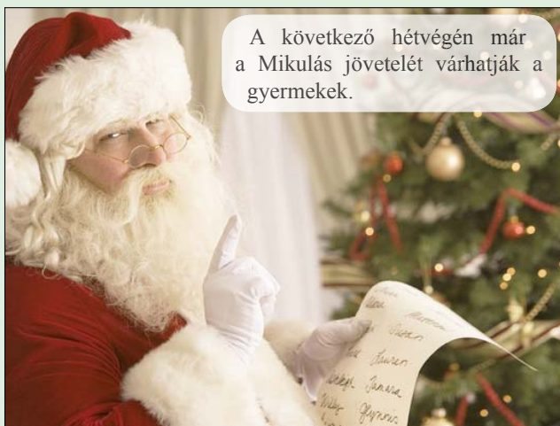
A következő hétvégén már a Mikulás jövetelét várhatják a gyermekek.