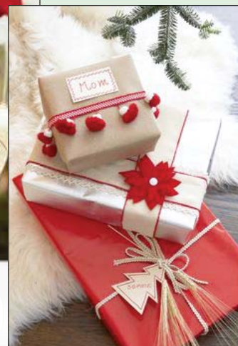
Ajándékainkat is becsomagolhatjuk nekünk tetszően.