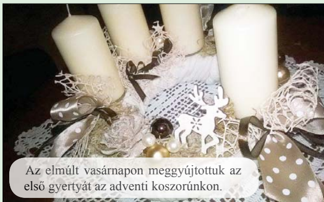
Az elmúlt vasárnapon meggyújtottuk az első gyertyát az adventi koszorúnkon.

Minden évben november végén, december elején elkezdődik az ünnepekre hangolódás, az adventi várakozás időszaka, mely mindannyiunknak nagy örömet okoz.