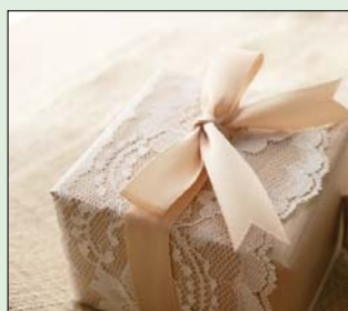
A csipkének most nagy divatja van.