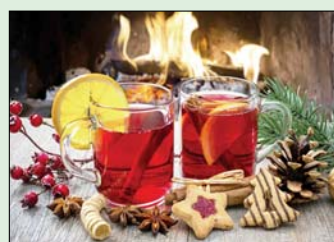
Az érzés, az illat, a melegség ne maradjon ki otthonunkból! Kellemes ünnepeket!