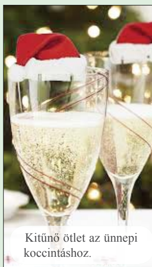
Kitűnő ötlet az ünnepi koccintáshoz.