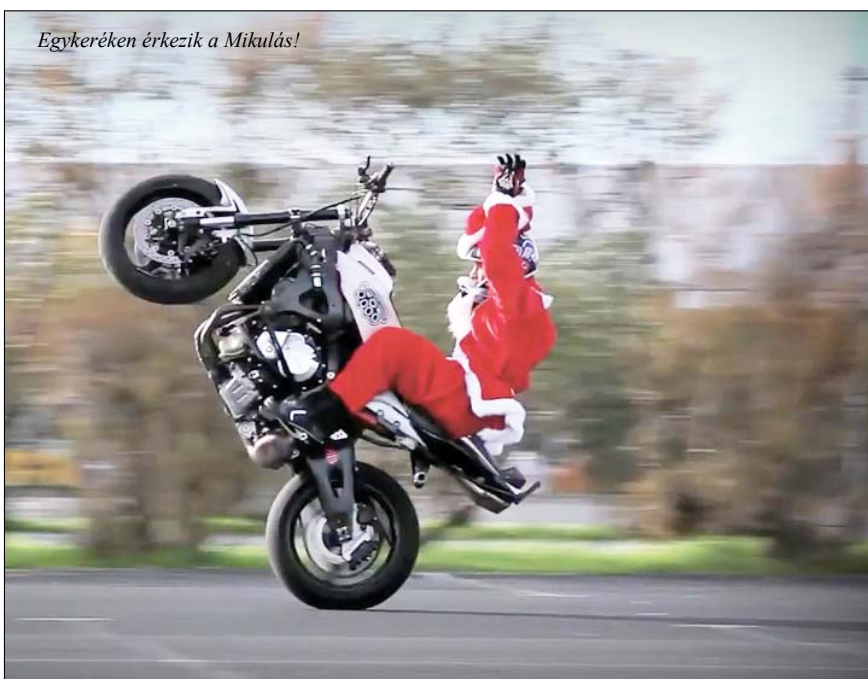
Egykeréken érkezik a Mikulás!