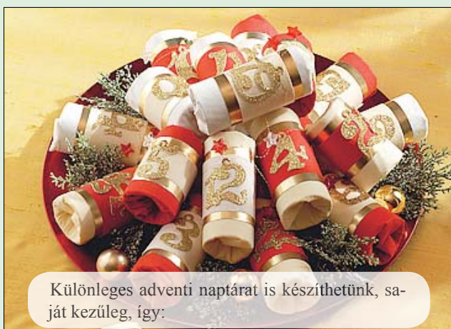
Különleges adventi naptárat is készíthetünk, saját kezűleg, így: