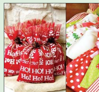
Kis zsákokat is készíthetünk az ajándékoknak.