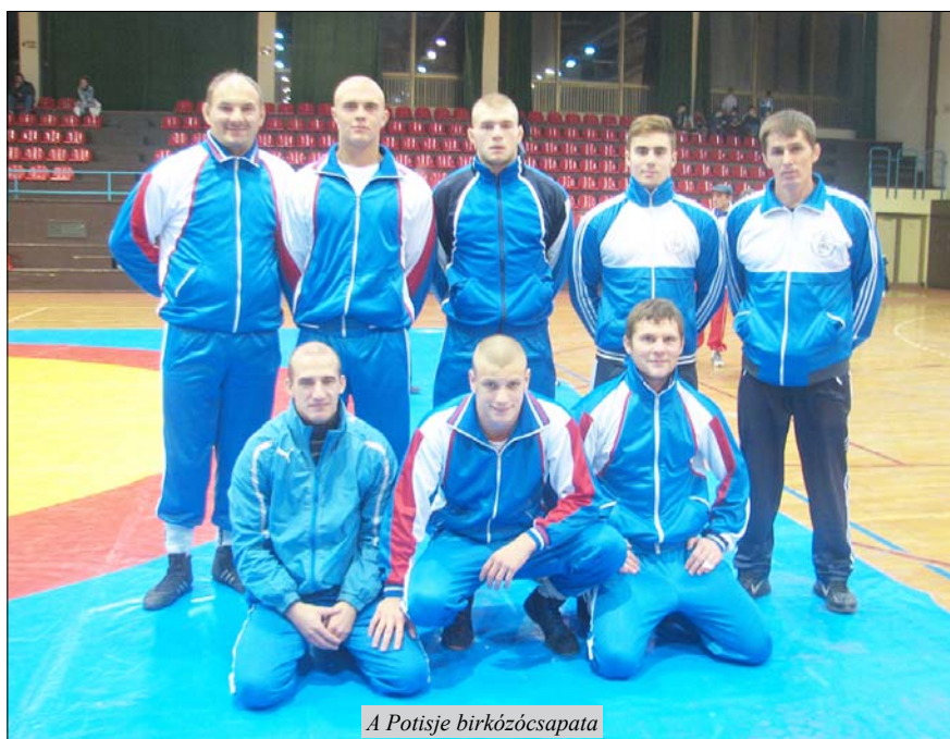
A Potisje birkózócsapata