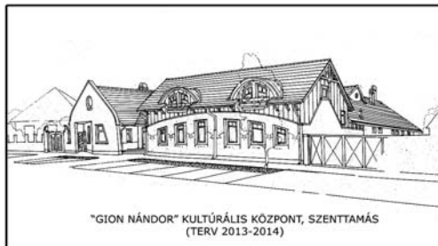
"GION NÁNDOR" KULTURÁLIS KÖZPONT, SZENTTAMÁS (TERV 2013-2014)

A szabadkai Munkásegyletem halljában a múlt héten megtartott ARH 007 című mérnöki kamarai kiállításon sorozatban hetedszer vehettem részt, felmutatva munkáim által a vajdasági magyar regionális építészet jegyeit. Idei tablón a 2013/14-ben tervezett – eddig sajnos még papíron maradt – szenttamási magyar Művelődési központot mutattam be. A Gion Nándorról elnevezett központ helyszíne a Szent kereszt katolikus templom és plébánia közvetlen közelében található, melyekkel bizonyos egységet képez. A központ objektuma földszintes, részben tetőtér-beépítéses, tagolt épület. Alapkonceptiója L-alakban elképzelt – kiépített utcafronttal és meghitt udvarral. A kocsis- és gyalogos bejáró egy nagykapun- illetve egy szárazkapun keresztül megoldott. Az épület-komplexum utcaféli architektúrájában a vajdasági magyarok kétfajta