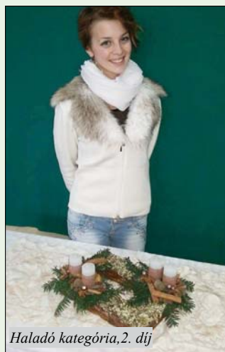
Haladó kategória, 2. díj