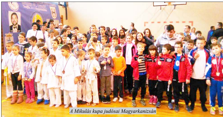
A Mikulás kupa judósai Magyarkanizsán