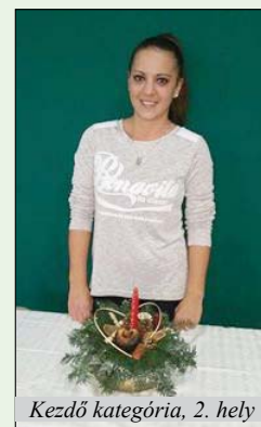
Kezdő kategória, 2. hely