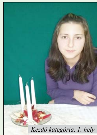
Kezdő kategória, 1. hely