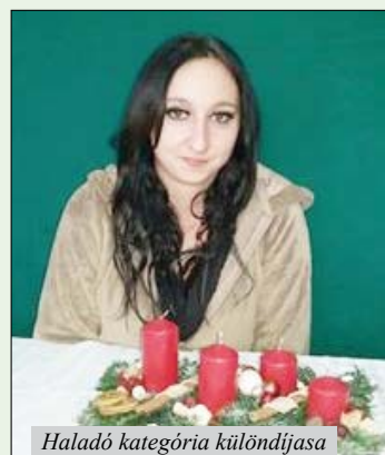
Haladó kategória különdíjasa