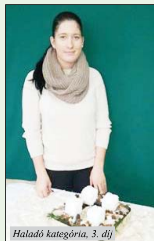
Haladó kategória, 3. díj