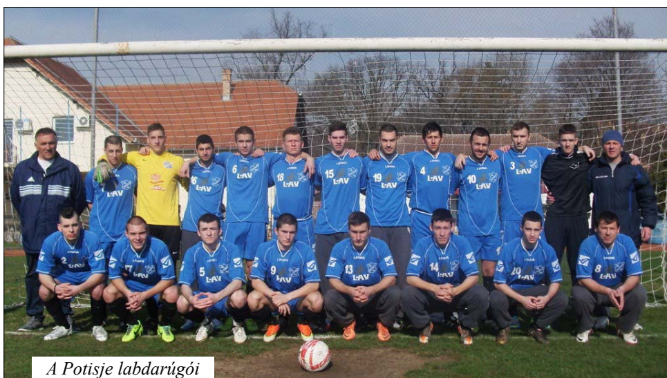
A Potisje labdarúgói

A Potisje hat felkészülési mérkőzést játszott a következő eredményekkel: Sloga (Tizsaszentmiklós)–Potisje 0:2, Jedinstvo (Martonos)–Potisje 0:1, Potisje–Olimpia (Tóthfalu) 1:4, Panonija (Duboka)–Potisje 1:1, Potisje–Bácska (Mohol) 3:2, Potisje–Elektrovojvodina (Szabadka) 1:1