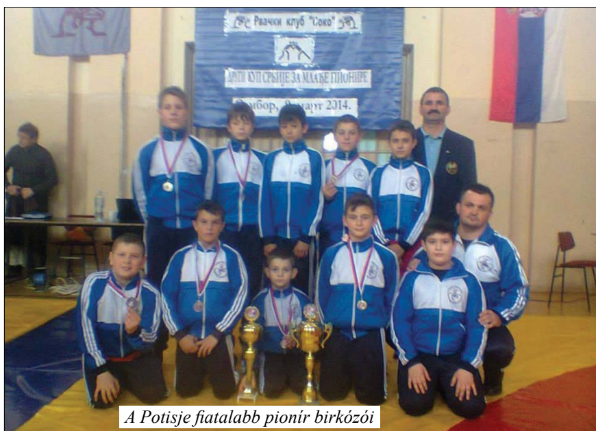
A Potisje fiatalabb pionír birkózói