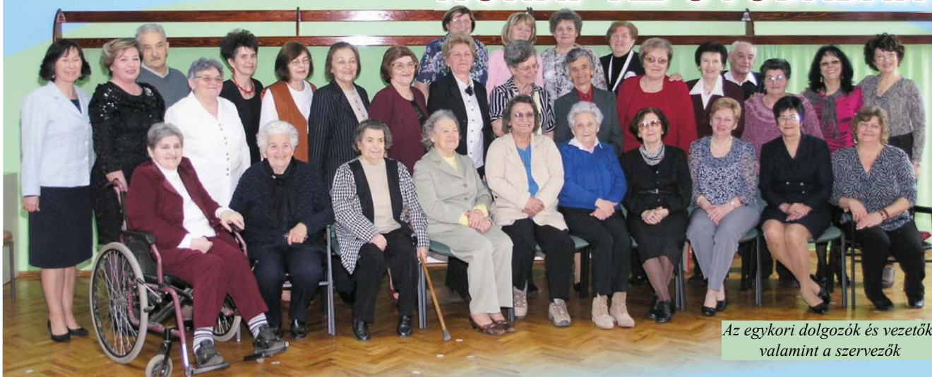
Az egykori dolgozók és vezetők, valamint a szervezők

A Gyöngyszemeink Iskoláskor Előtti Intézmény magyarkanizsai központi épületében március 8-án, szombaton ünnepelték a nők napját és ekkor búcsúztatták a közelmúltban nyugdíjazott dolgozókat is.