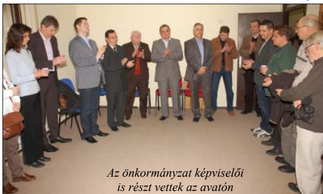
Az önkormányzat képviselői is részt vettek az avatón