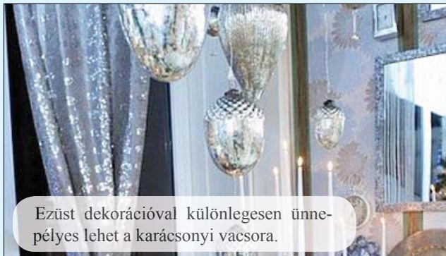
Ezüst dekorációval különlegesen ünnepléses lehet a karácsonyi vacsora.

Minden évben nagy gond, hogy milyen legyen a lakásban a karácsonyi dekoráció. Legyen hagyományos arany-piros-zöld, vagy talán másmilyen? Erre kerestem most néhány ötletet, hogy megkönnyítsem a választást!