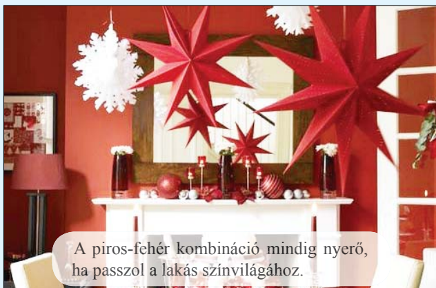
A piros-fehér kombináció mindig nyerő, ha passzol a lakás színvilágához.