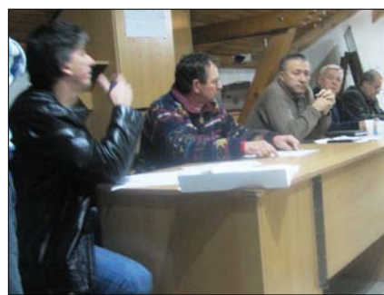
Ülésznek a Labdarúgó-szövetség

A tóthfalusi Nyers István Labdarúgó-akadémia nagytermében tartották meg a Magyarkanizsa–Zenta–Ada Községi Labdarúgó-szövetség rendkívüli választási ülését. A Magyarkanizsa–Zenta–Ada Községi Labdarúgó-szövetségnek három községből 11 klub a tagja, akik különböző versenyfokokban szere-