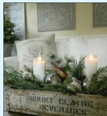
A rusztikus láda, a fehér gyertyák és az élő zöld fenyő a természetességet tükrözi.