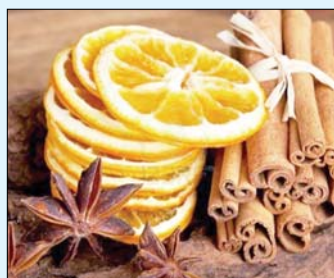
Az ünnepi hangulathoz ne feledjék az illatokat és ízeket sem!