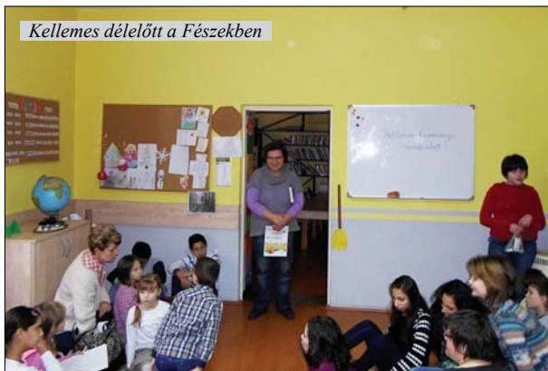
Kellemes délelőtt a Fészekben