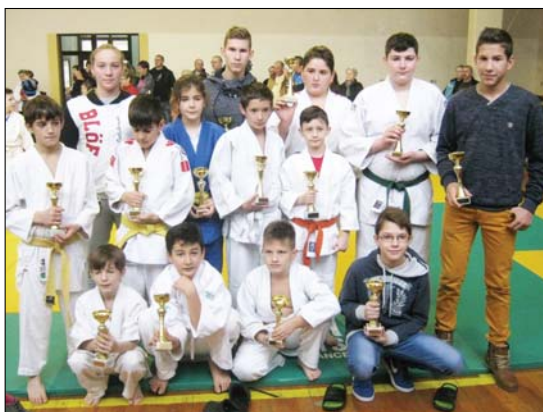
A Partizan KOT díjazottjai