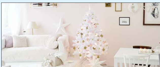
Mesebeli ragyogás – púder és fehér dekoráció egy letisztult lakásban.