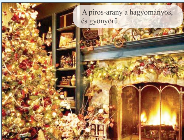
A piros-arany a hagyományos, és gyönyörű.