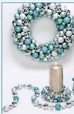
Kék-ezüsttel, a hűvös elegancia jelképe.