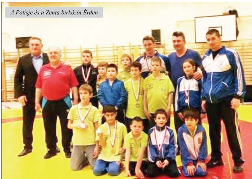
A Potisje és a Zenta birkózói Érden