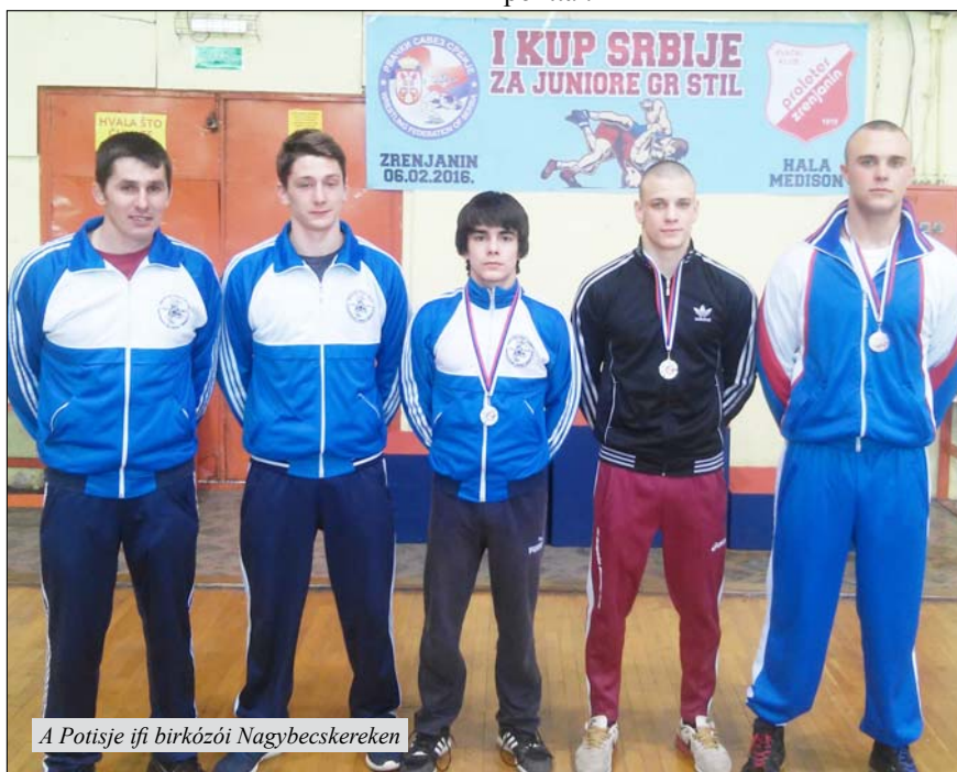
A Potisje ifi birkózói Nagybecskerekén

A csapatverseny sorrendje: 1. Partizan (Belgrád) 19, 2. Soko (Zombor) 16, 3. Spartak (Szabadka) 16, 4. Potisje 15 pont, stb.