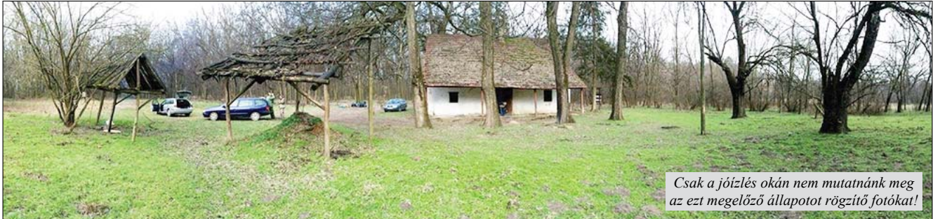
Csak a józslés okán nem mutatnánk meg az ezt megelőző állapotot rögzítő fotókat!