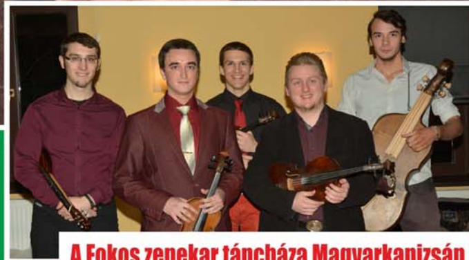
A Fokos zenekar tánc háza Magyarkanizsán