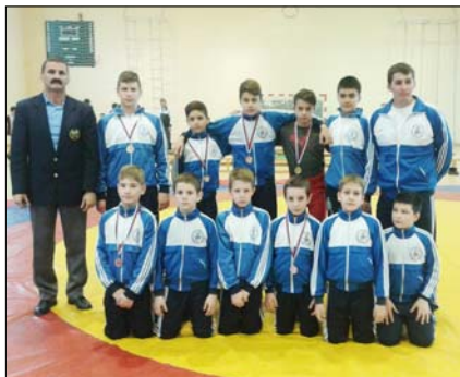
A Potisje fiatalabb pionír birkózói Moholon