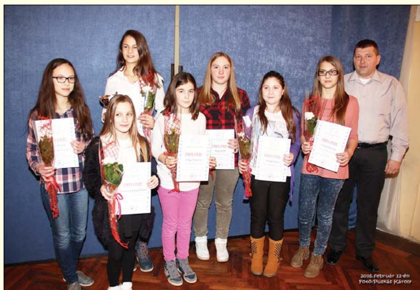
2016. FEBRUÁR 22-ÉN