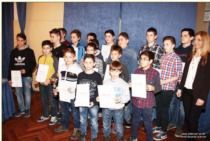
2016. FEBRUÁR 22-ÉN