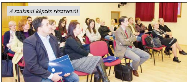
A szakmai képzés résztvevői

– Szociális munkások képzése az UNICEF támogatásával Magyarokanizsán –