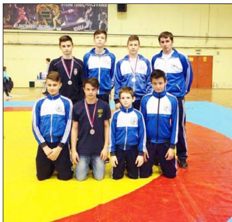
A Potisje idősebb pionír birkózói Nagybecskerekén