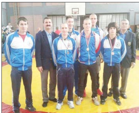
A Potisje U-23-as birkózói Zomborban

A csapatverseny sorrendje: 1. Spartak 35, 2. Partizan (Bg) 27, 3. Zenta 18, 4. Novi Sad 18, 5. Potisje 17 pont, stb.