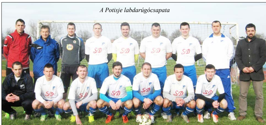
A Potisje labdarúgócsapata