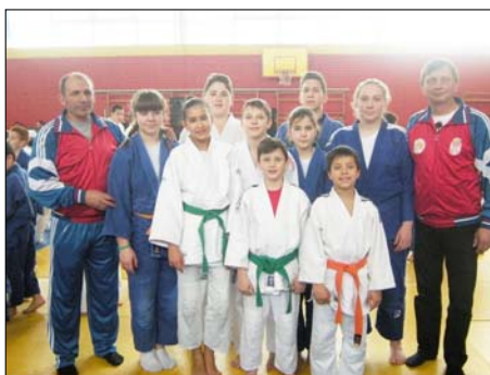
A Partizan KOT judósai Turian

Kiválóan szerepeltek a magyarkanizsai Partizan KOT pionír judósai Szenttamáson. A turiai judoklub hagyományos nemzetközi judoversenyének idén a szenttamási Elan hotel sportsarnoka adott otthont. A versenyre Horvátország, Makedónia, Románia, Magyarország, Bosznia-Hercegovina és Szerbia összesen 51 klubjából 577 versenyző küzdött meg a jó eredmények reményében. A magyarkanizsai Partizan judoklub 9 versenyzővel érkezett, akik