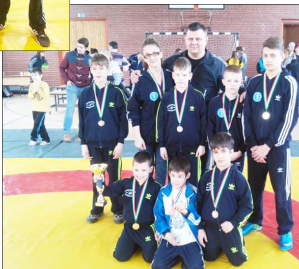
Potisje és két zentai birkózó Kiskőrösön