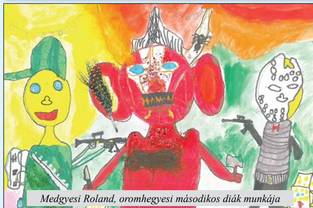
Medgyesi Roland, oromhegyesi másodikos diák munkája