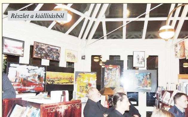
Részlet a kiállításból