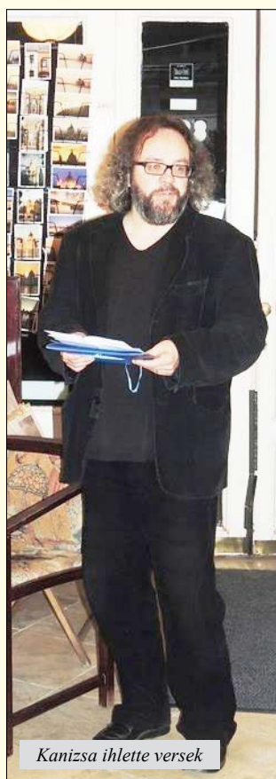
Kanizsa ihlette versek

Háta mögött a január kopott préme Vállán a naptalan, vimyogó szenvedély Ha tehetné, virágot kérne az úrbe Ha merné, ember lenne. Nagyszerű, kevély.”*