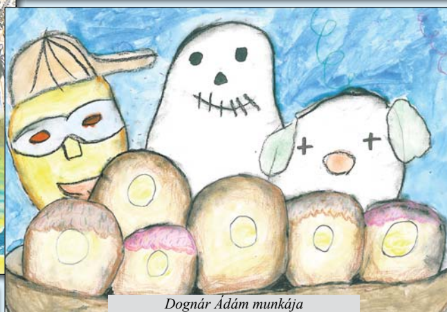
Dognár Ádám munkája