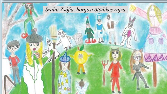
Szalai Zsófia, horgosi ötödikes rajza