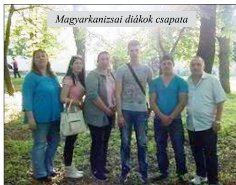
Magyarkanizsai diákok csapata

A három diák felkészítő tanárai úgy nyilatkoztak, elismerésre méltó, hogy a 60, az ország más-más közegéből érkezett versenyző közül három diáuk eredményesen szerepelt, és időre elvégezte a feladatot.