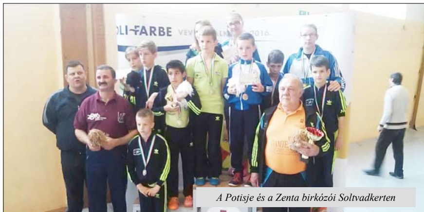
A Potisje és a Zenta birkózói Soltvadkertben