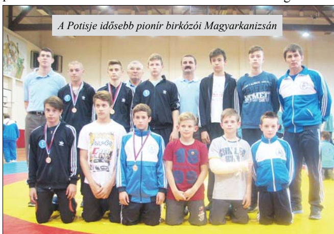
A Potisje idősebb pionír birkózói Magyarkanizsán

A csapatverseny élcsoportja: 1. Soko 25, 2. Spartak 24, 3. Potisje 22 pont stb.