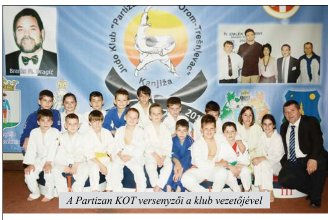
A Partizan KOT versenyzői a klub vezetőjével