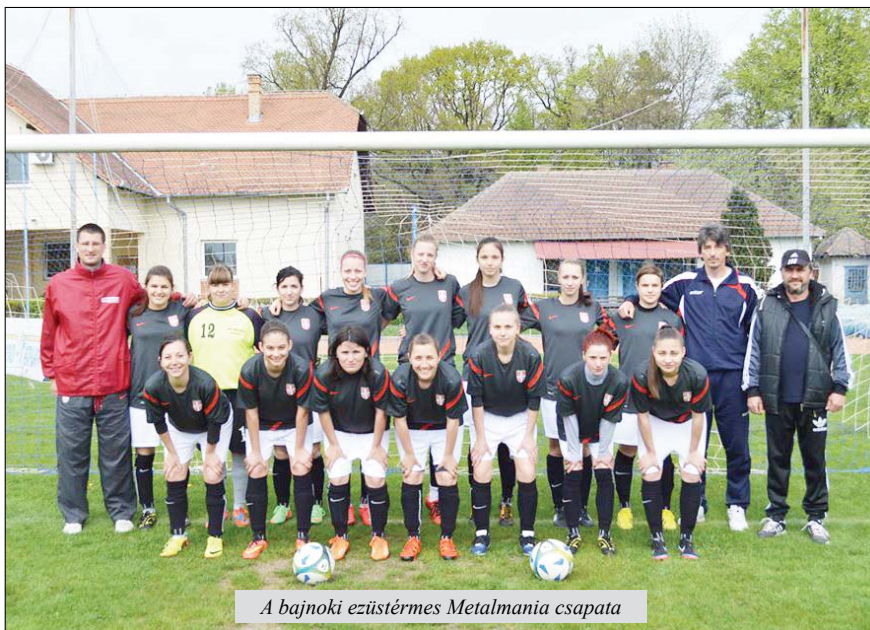
A bajnoki ezüstérmes Metalmania csapata