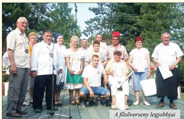
A főzőverseny legjobbjai

A vendégeket gazdag kirakodóvásár fogadta, volt ott minden a játékoktól az édességekig, a kézműves termékektől a kecskesajtokig.