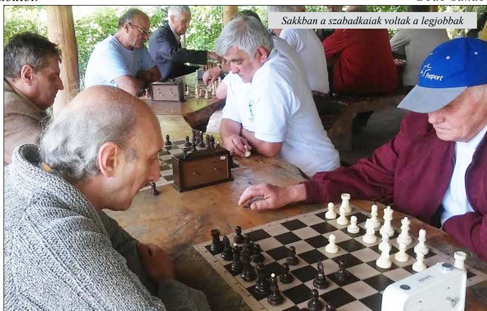
Sakkban a szabadkaiak voltak a legjobbak