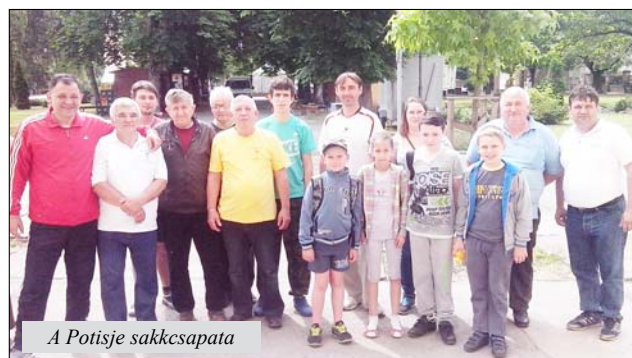
A Potisje sakkcsapata