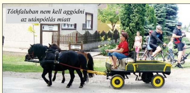
Tóthfaluban nem kell aggódni az utánpótlás miatt

A nap folyamán a gyerekek trambulion, körhintán és csúszdán szórakozhattak. Lehetett lovagolni, fiákerezni, akit érdekelt, íjászkozhatott is, vagy élvezhette a repülőmodellezők bemutatóját. Volt fagyi, vattacukor, édesség, sőt Balog Goran zentai királyi szakács csapatának jóvoltából frissen sültött ízletes palacsintát is ehettek a gyerkőcök.