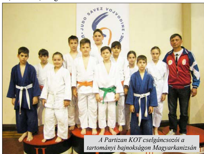
A Partizan KOT cselgáncsozói a tartományi bajnokságon Magyarkanizsán

Az élcsoport: 1. NK Inženjering 22, 2. Neofarm apoteka 22 pont, stb.