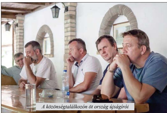
A közönségtalálkozón öt ország újságírói

Vasárnap a társaság kikocsikázott Kispiacra, ahol a soron következő hónapos vásár hamisítatlan bácskai hangulata fogadta őket. Kattogtak a fényképezőgépek, születtek a jobbnál jobb képek. Nemhiába: a messze földön híres kispiai forgatag, a sok látnivaló, a már feledésbe merült népi és kézműves árucikkek, a jószágvásári látnivalók egytől-egytől lenyűgözték a zömmel nagyvárosokban élő zsurnalisztákat. Az, hogy mennyire inspiráló lehet a