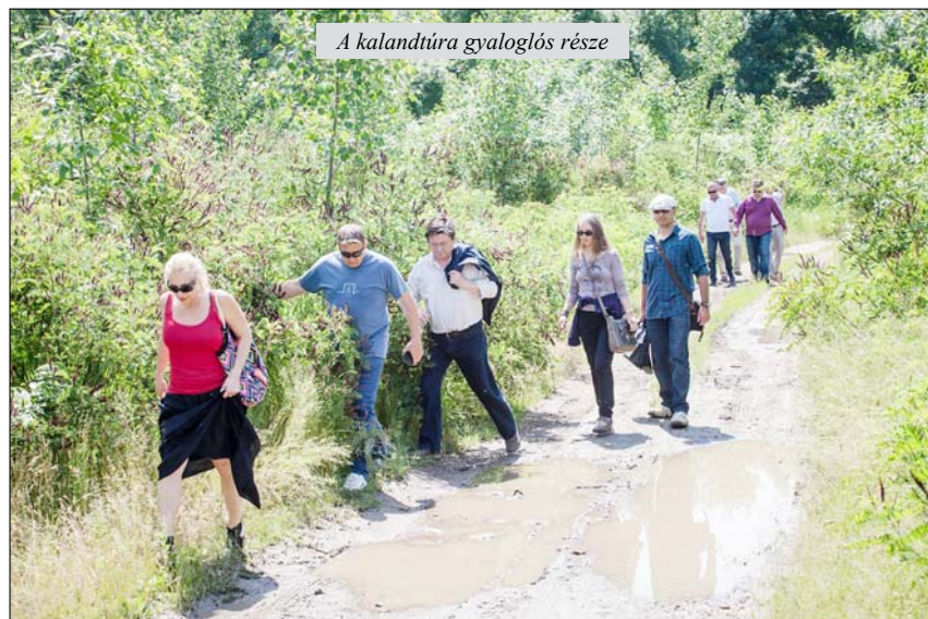
A kalandtúra gyaloglós része