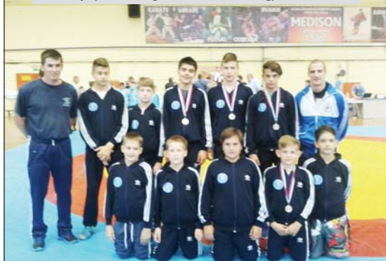
A Potisje fiatalabb pionír birkózói Nagybecskerekén

A csapatverseny élesoportja: 1. Proleter 31, 2. Zenta 28, 3. Potisje 27 pont, stb.