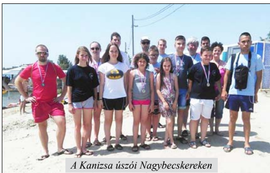
A Kanizsa úszói Nagybecskereken