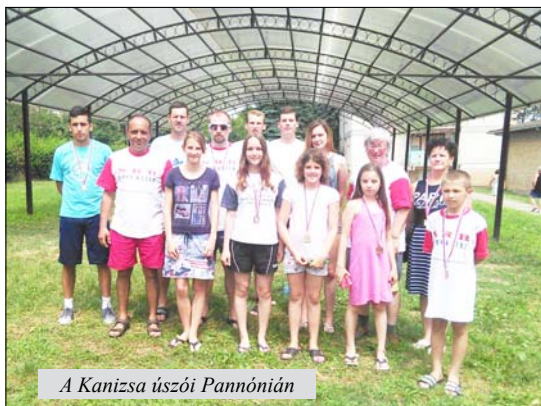
A Kanizsa úszói Pannónián