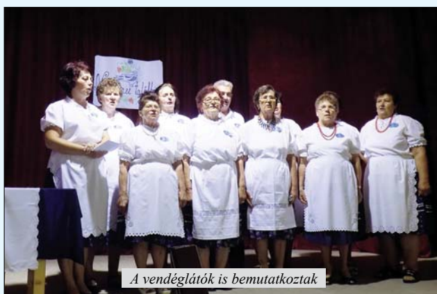
A vendéglátók is bemutatkoztak

A Petőfi Sándor Művelődési Egyesület nagytermében délután öt órai kezdettel viszont népzenei találkozó volt. A résztvevő egyesületek, népdalkórusok Völgyesről, Oromhegyesről, Magyarkanizsáról, Kispiachról, Felsőhegyről, Ludasról, Kispiachról és Palicsról érkeztek, és természetesen a vendégfogadó helyiek is felléptek. A másodízben tartott összejövetel kellemes hangulatban telt, minden kórus bemutatkozott a saját összeállításával, ezt követően megtekintették a tájházat, utána pedig muzsikaszó mellett közösen fogyasztották el a csirkepaprikást, amivel az oromiak megvendégelték őket.