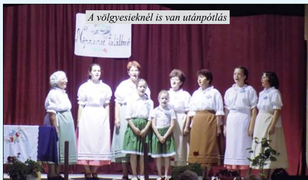
A völgyesieknél is van utánpótlás