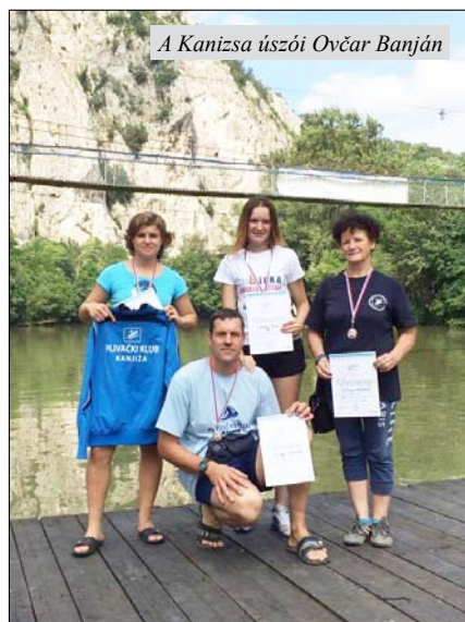
A Kanizsa úszói Ovčar Banján