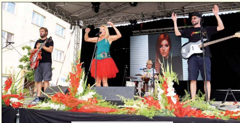
Pillanatképek a délutáni programból

Ebédidőben a Fő téren bárki leülhetett, hisz rotyogott a bográcsokban a pörkölt, ízletes sülték készültek, de lángos, kürtöskalács, főtt kukorica, fagyalt, vattacukor és sok csemege is kínálta magát ínycsiklandóan. Délután a községünkben működő művelődési egyesületek fellépőit láthattuk majd sor került a legszebb