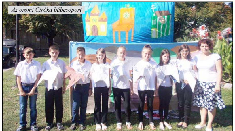
Az oromi Ciróka bábcsoport

Maga a kiállítás hivatalos megnyitója már a képtár falain belül zajlott, ahol Pósa Károly önálló versét mondta el, majd Kerekes Sándor szabadkai festőművész hivatalosan is megnyitotta a kiállítást. Megnyitóbeszéde igen lényegretörő volt, melyben kiemelte az amatőrizmus fontosságát, hangsúlyozva: amatőrizmus nélkül nem létezik valódi művészet sem!