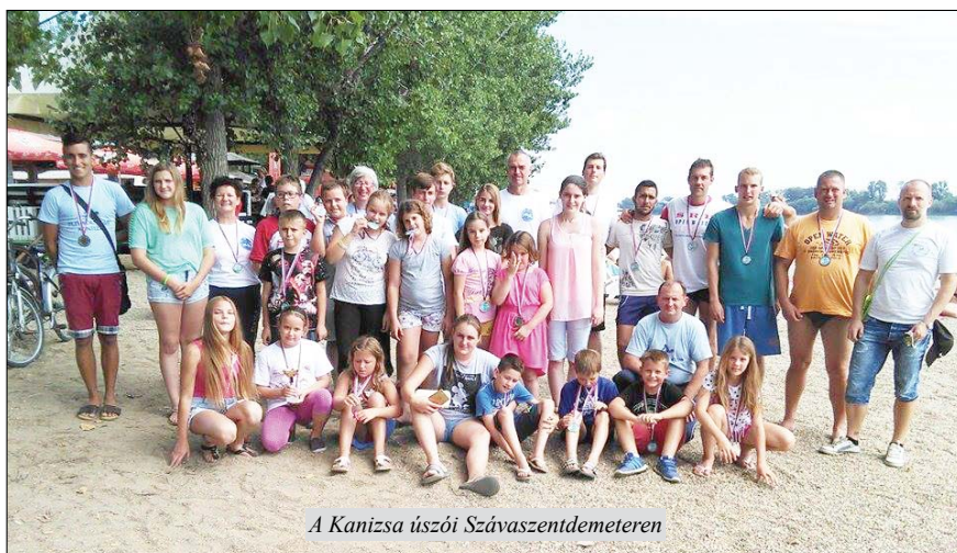
A Kanizsa úszói Szávaszentdemeteren