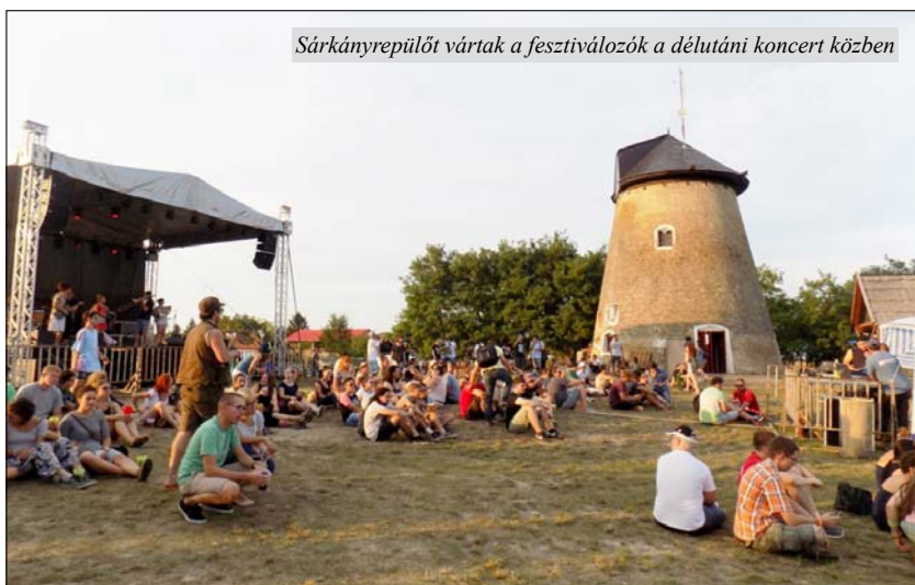
Sarkányrepülőket vártak a fesztiválózó a délutáni koncert közben

darbuka és kendama-oktatás, Nőnek lenni, nőként élni elnevezéssel is tartottak műhelymunkát, a filozófia iránt érdeklődőknek a malom árnyékában jutott egy egész sátornyi hely, de a kézművesek is igen nagy területet mondhattak a magukénak.