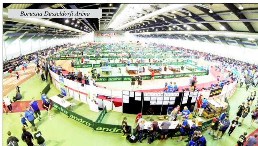
Borussia Düsseldorf Arena