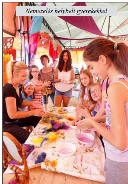
Nemezélés helybeli gyerekekkel

tapasztaltuk még, hogy az elvesztett-megtalált tárgyak nem kerültek be az info pultunkba, ami egyben a talált tárgyak osztálya volt. Vannak fesztiválok, amelyeken drága mobiltelefonok, hangszerek találhatnak vissza gazdájukhoz, nálunk bizony más még ennek a kultúrája. Tisztelet természetesen a kivételnek. Ami még a rendellenességet illeti, egyszer voltam