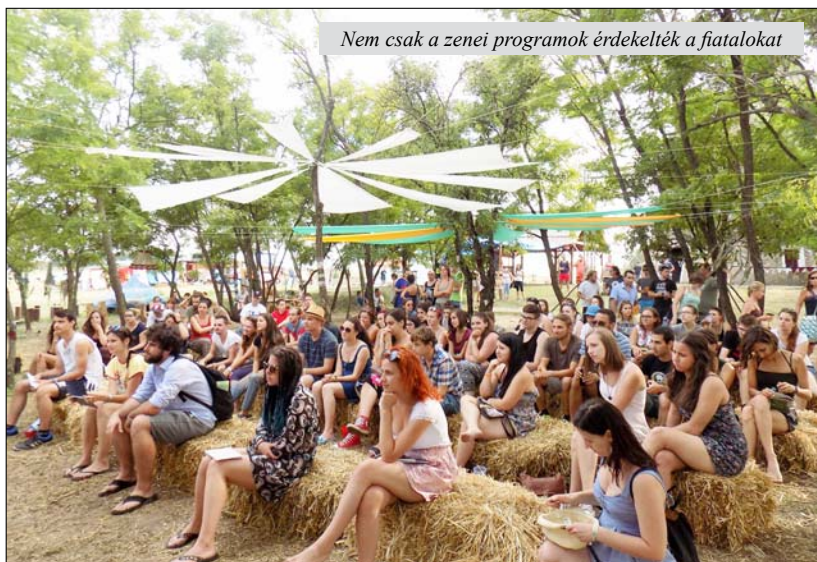
Nem csak a zenei programok érdekelték a fiatalokat