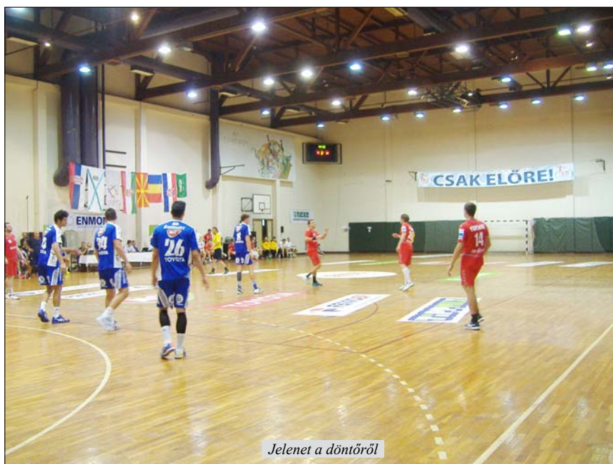
Jelenet a döntőről