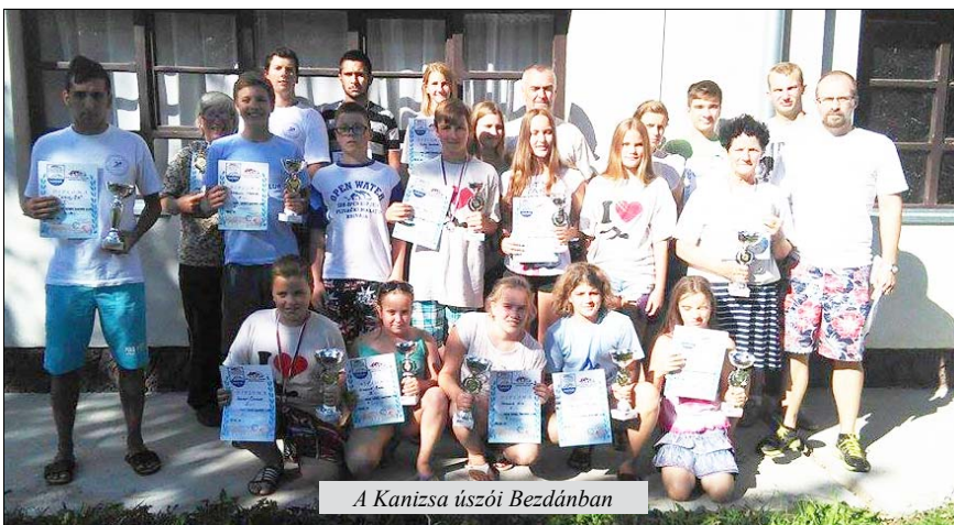
A Kanizsa úszói Bezdánban