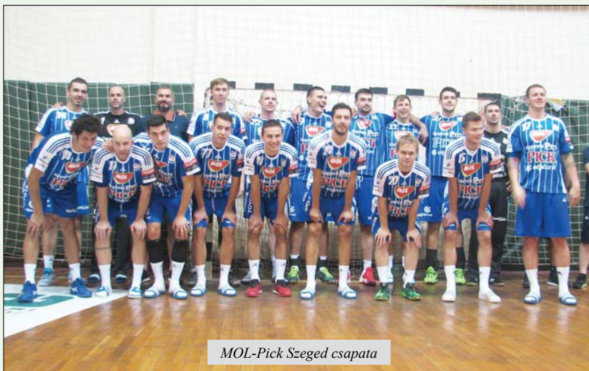
MOL-Pick Szeged csapata

MOL-Pick Szeged-HC Dobrogea Sud Constanta 32:23 (17:9). Legeredményesebb góldobók: Šoštarić 6 illetve Crnoglavac 6 góllal.