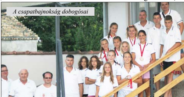
A csapatbajnokság dobogósai