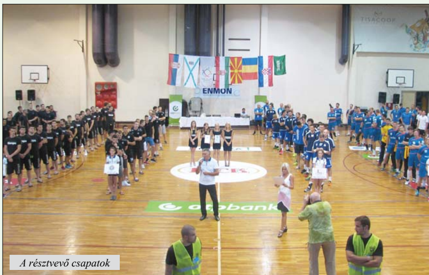
A résztvevő csapatok