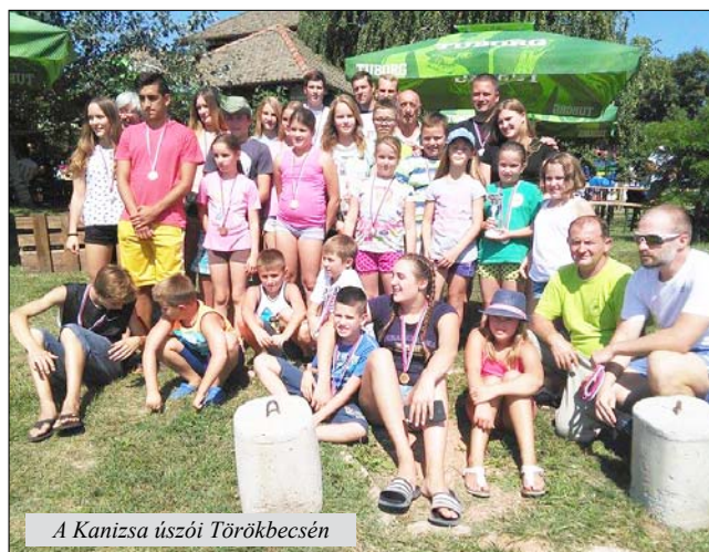
A Kanizsa úszói Törökbecsén