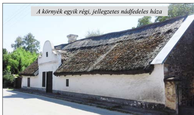
A környék egyik régi, jellegzetes nádfedeles háza

Táborunk harmadik napja egybeesett a falunappal, s mi sem volt természetesebb, hogy részt vegyünk a rendezvényen. Főztünk is közösen, egy nagy bográcsban, lecsót, olyan Kárpát-medenceit, népfőiskolákat – mindenki hozzatott valamit.