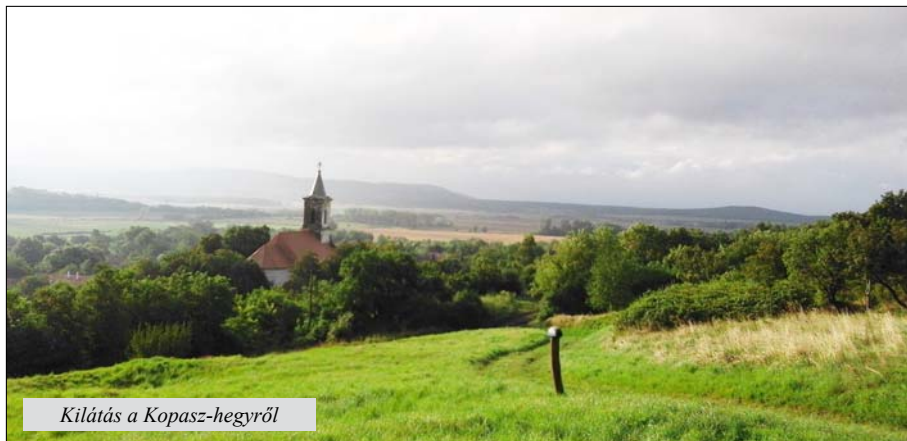
Kilátás a Kopasz-hegyről