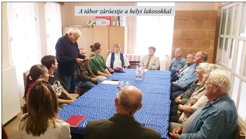
A tábor záróestje a helyi lakosokkal

Szabadidőnkben feltérképeztük a környéket, sokat sétáltunk a faluban és a szomszédos Mindszentkállán, ahol a szállásunk volt. Megmártózzunk a Balatonban és megmásztuk a Kopasz-hegyet, a híres kékkúti ásványvízforrásból töltöttük fel vizespalackjainkat, megnéztük a mosót, azt az állandó hőmérsékletű forrást, ahol az asszonyok a ruhákat öblítették régen, és ahol a vágóhídi munkák nagy része is folyt valamikor. A Káli-medence jellegzetes természeti képződményei, a szentbékállai és a kővágóörsi kötengerek sem maradhattak ki kirándulásaink célpontjából, ugyanakkor a helyiek vendégszeretetéit is megtapasztalhattuk, akik otthonukba hívtak meg bennünket egy-egy kellemes estére.