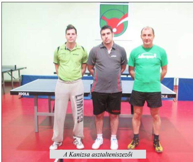
A Kanizsa asztaliteniszesei

A Potisje kilencedik a táblázaton 6 ponttal.