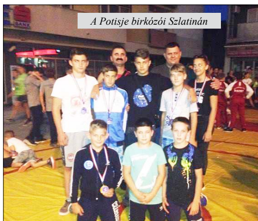
A Potisje birkózói Szlatinán