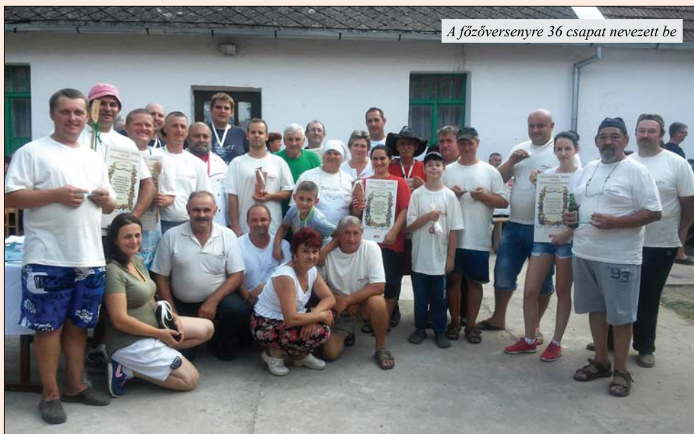
A főzőversenyre 36 csapat nevezett be