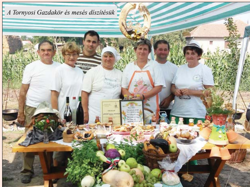
A Tornyosi Gazdakör és mesés díszítésük

itt mindig igazán családias a hangulat, ami talán az egyik oka lehet annak, hogy ilyen sokan ellátogattak Völgyesre. A másik ok pedig mi más lenne, mint a nyolc óra óta készülődő finomabbnál finomabb bográcsos. Eleinte csak egy-két szakács állt a tűz mellett, de 12 órára már megtelt az udvar a sok éhes hassal. Idén is lehetett az egyesület bográcsosából vásárolni paprikást, valamint szokás szerint az édesszájúaknak palacsintával kedveskedtek a helyiek. Természetesen a muzikaszó sem maradhatott el, amit ebben az évben az oromhegyesi Délibáb együttes szolgáltatott. Amit még nem hagynék ki, hogy a csapatok szebbnél szebb terítékeket tettek az asztalra, sokan őszi termésekkel, régies tárgyakkal díszítették azt, és persze a jó kis házi pálinka sem hiányzott egy asztról sem.