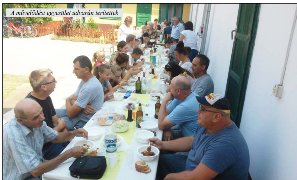
A művelődési egyesület udvarán terítettek