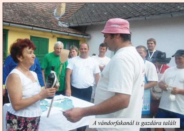
A vándorfakanál is gazdára talált