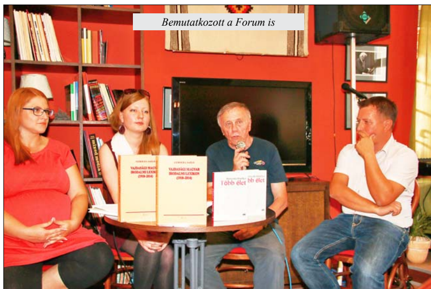
Bemutatkozott a Forum is