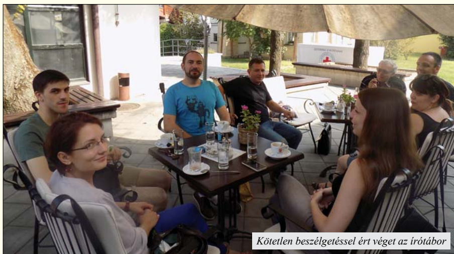
Kötetlen beszélgetéssel ért véget az íróktábor

–Az íróktábor megpróbál megszólítani mindenkit, aki Vajdaságban irodalommal foglalko-