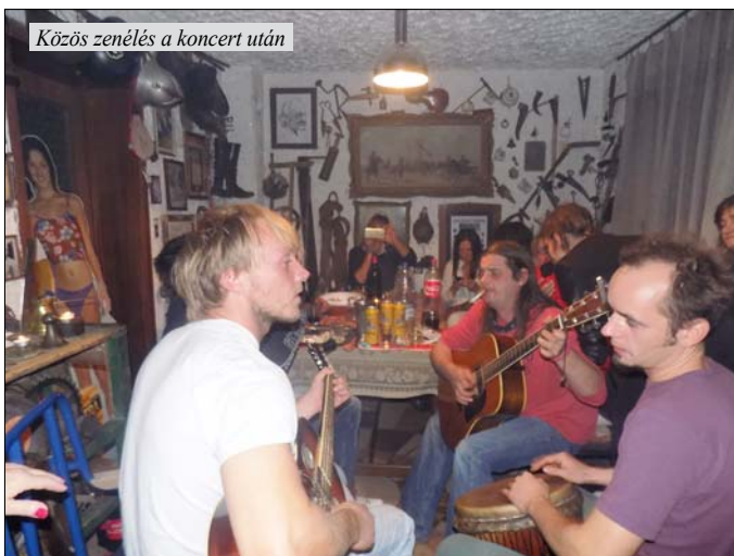
Közös zenélés a koncert után