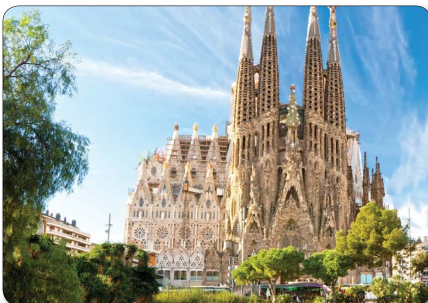
A felvétel Spanyolországban készült. Vajon melyik ismert hely látható a képen? (Sagrada Família templom, Spanyolország)