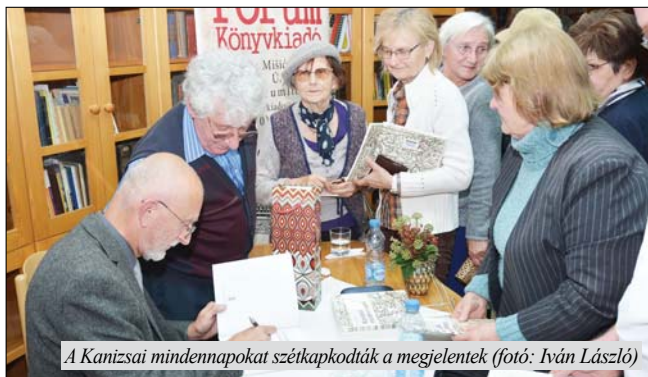
A Kanizsai mindennapokat szétkapkodták a megjelentek

– Olyan könyvet szerettem volna adni – ahogy mások mondják – „választott” szülővárosom olvasóinak kezébe, ami nem hemzseg a száraz adatoktól, hanem emlékeiken, szívükön és lelkükön keresztül valamennyiüket megérinti. Könyvem történetfüzérékből áll, amelyek otthonossá teszik a várost, segítenek abban, hogy megértsük az elmúlt századokat és azokból merítkezve megértsük Kanizsa lehetőségeit, a fejlődését, de a jövőjét is – mondta a szerző.