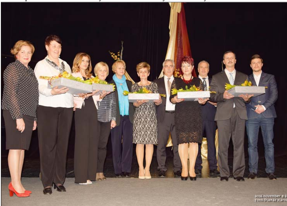
2016. november 8-án

A díjak kiosztása után állófogadással egybekötött társalgás, beszélgetés volt a Regionális Szakmai Továbbképző Központ épületében.