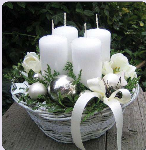
Kosárba is tehetjük a négy fehér gyertyát.