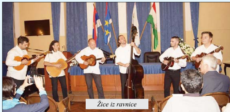
Žice iz ravnice