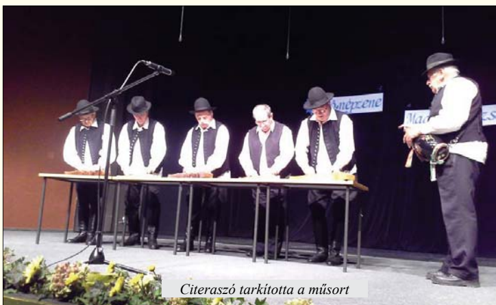
Citeraszó tarkította a műsort

Tizenegy produkciót láthattunk, ebből egy néptánc, míg a többi a népdal kategóriát képviselte. A citerások, köcsög-dudások először saját egyesületükkel szerepeltek, de a későbbiekben a zenei háttért nélkülöző kórusokhoz csatlakozva közös fellépések is születtek. Nagyon magas színvonalú előadásokat hallhattunk, művészi igényességgel és csupa szívvel előadva. Mindezt szépszájú közönség követte, talán teltház is lehetett volna a Cnesa színháztermében, ha az itt megrendezett élő népzenevel párhuzamosan a városháza dísztermében nem épp a tamburafesztivál zajlik.