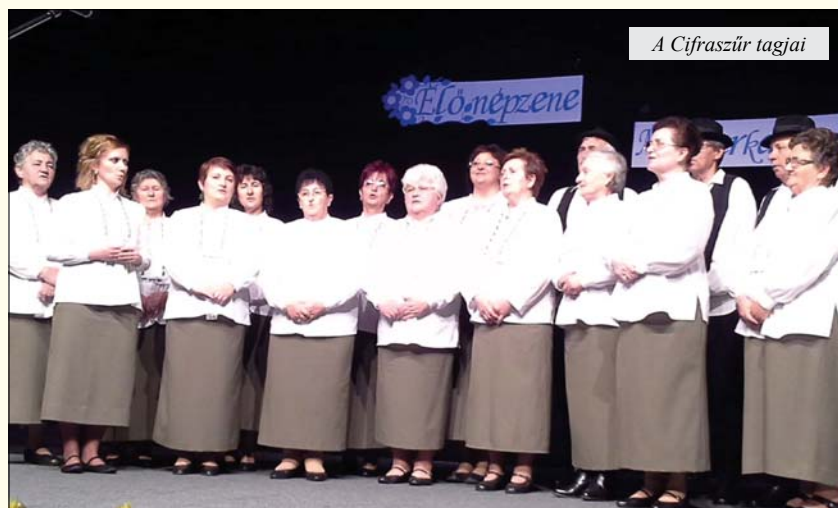
A Cifraszúr tagjai