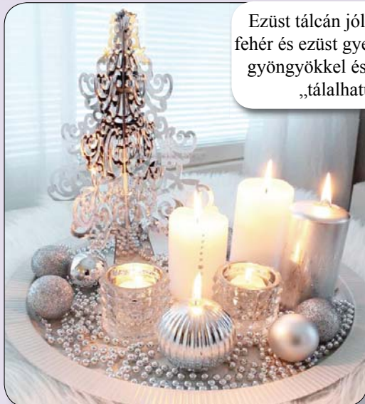
Ezüst tálcán jól mutatnak a fehér és ezüst gyertyák, melyet gyöngyökkel és gömbökkel „tálalhatunk”.