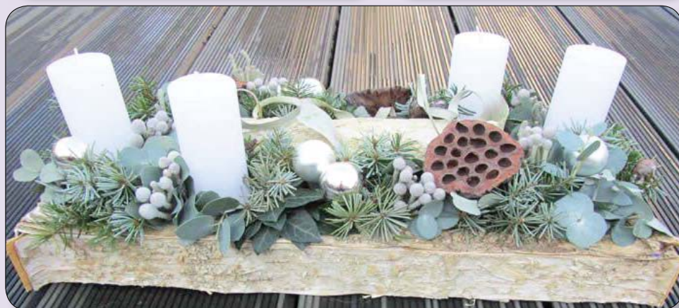
Fából készült doboz az alapja ennek az adventi dekorációnak.

Beszerezhetünk ilyen ezüst gyertyatartókat, néhány gömbbel kiegészítve csodálatos dísz lehet otthonunknak és mindezt fa tálcára téve bármikor arrébb tehetjük, ha helyhiány van az asztalon.