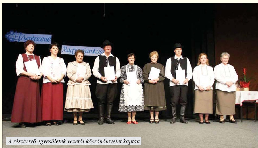
A résztvevő egyesületek vezetői köszönőlevelet kaptak

– Százan daloltak a Művészetek Házában –