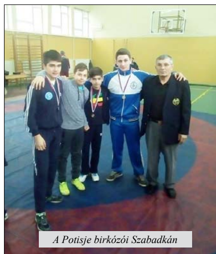
A Potisje birkózói Szabadkán