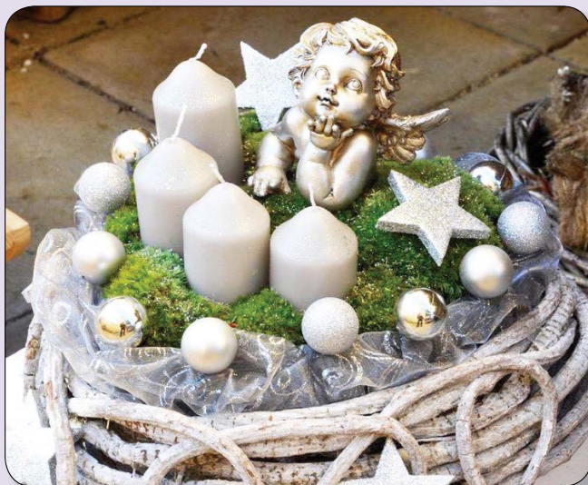
A koszorúkat ékesíthetjük angyalkával és csillagokkal.

Ideje készülödni, hiszen alig bő egy hét van hátra az első adventi gyertya meggyújtásáig! Idén nagyon kedvelt lesz az adventi koszorúk körében a natúr-fehér színek, a természetesség jegyében. Sokan megvásároljuk, de könnyedén el is tudjuk készíteni azokat saját kezűleg is. Az alapanyagokat beszerezve már hozzá is foghatunk a készülődéshez.