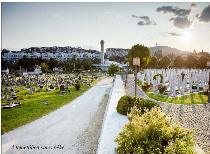
A temetőben sincs béke

Čitluk, Međugorje, Mostar környéke – s ez kis túlzással az egész Hercegovináról is elmondható – arról jellegzetes, hogy nincsen benne semmi jellegzetes. Kő hátán kő. Kavicson kavics. A föld vörös, korán kiég benne a fű. Az Adria közelsége miatt inkább esősek a telek, hogy utána a nyarakon pirostra sülhessen a vándor, az átutazó turista, vagy a keresztény zarándok. Nem véletlen, hogy a hajdani Jugoszlávia legforróbb klímájú városaként éppen Mostart emlegették. Egy lapos katlanban helyezkedik el, jó száraz szelek nyargalnak végig rajta. Az égbolt valószínűtlenül kék. Seholy egy felhő. Ha lenne akkora tojás, augusztus némelyik napján a Teremtő rántottát bírna sütni, mikor éhes kedvében ráüti Mostar platnijára. A kopár táj ellenére Hercegovina szerzte zajlik az élet. Az út mentén ültetvények, gyümölcsösök sorakoznak, s a mellékutakról traktorok, munkagépek robognak el mellettünk. Rejtély mi az, amivel érdemes vergődni ezen a terméketlen földön. A satnya kukoricásokkal netán? Mint a Balkánon szokás, a lakóházak jobbára emeletes, padlásszobás épületek. Zömük a befejezetlenség látszatát kelti. Alig némelyik van bepucolva, egyedibb, igényesebb építményt csak nagy ritkán pillanthatunk meg. A házakon, a köztereken, a középületeken sakktableás horvát lobogó virít. Bosznia legdél-