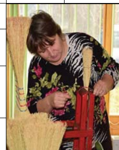
Készítette: Tocko Erika