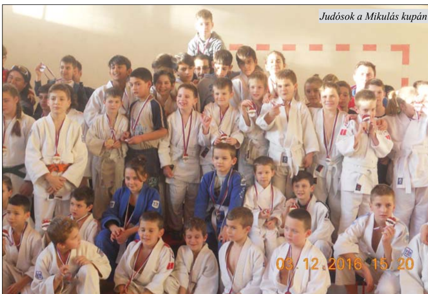
Judósok a Mikulás kupán

A sorrend: 1. Vrbas (9 győzelem, 3 vereség, 58,5:37,5) 18 pont, 2. Kanizsa (9 győzelem, 3 vereség, 58:38) 18, 3. Tikvara 17, 4. SPENS 16, 5. NS 1932 14, 6. Becse 14, 7. Sloboda 14, 8. Veteran BMV 14, 9. Junaković Prigrevica 12, 10.