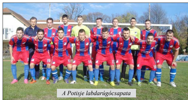
A Potisje labdarúgócsapata

– Mi az őszi idényben felmértük a lehetőségeinket az új környezetben és