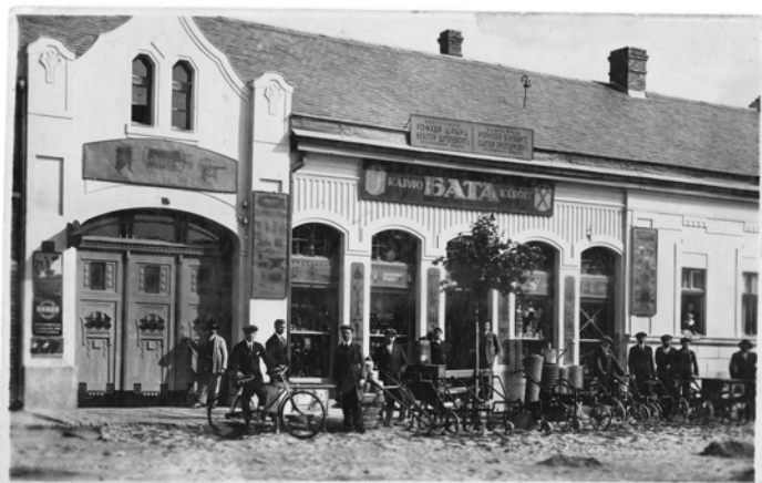
A FŐUTCAI BATA VASKERESKEDÉS (1912)

Sajnos, a második világméretű veszedelem után üzletét államosították. Mára a valamikori Bata-vasas épületének lecsupaszított homlokzatát nézve, emlékezetvesztéses korszakunkban talán eszünkbe se jutna, hogy valaha egy tehetős és sikeres ember élt és dolgozott e falak között!