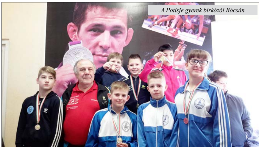
A Potisje gyerek birkózói Bócsán