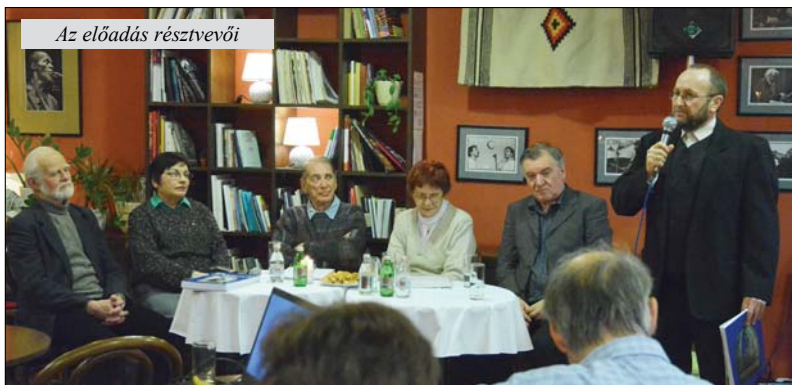
Az előadás résztvevői