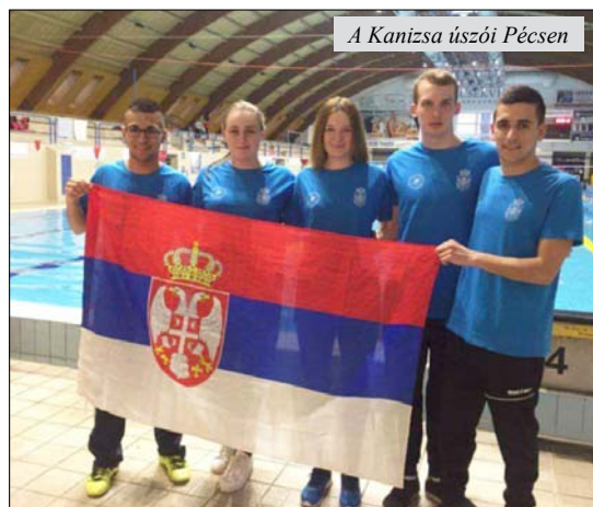
A Kanizsa úszói Pécsen