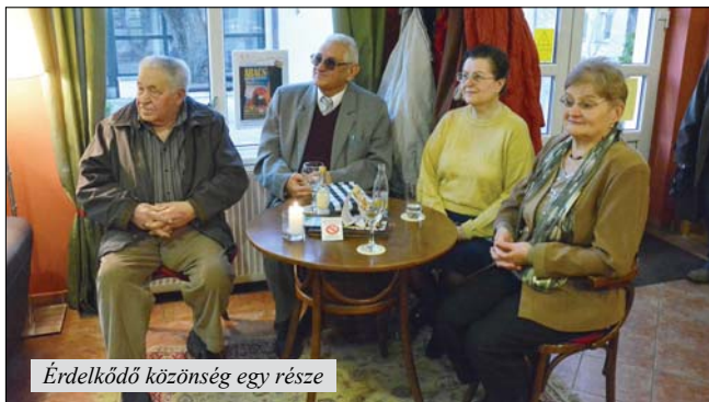
Érdeklődő közönség egy része