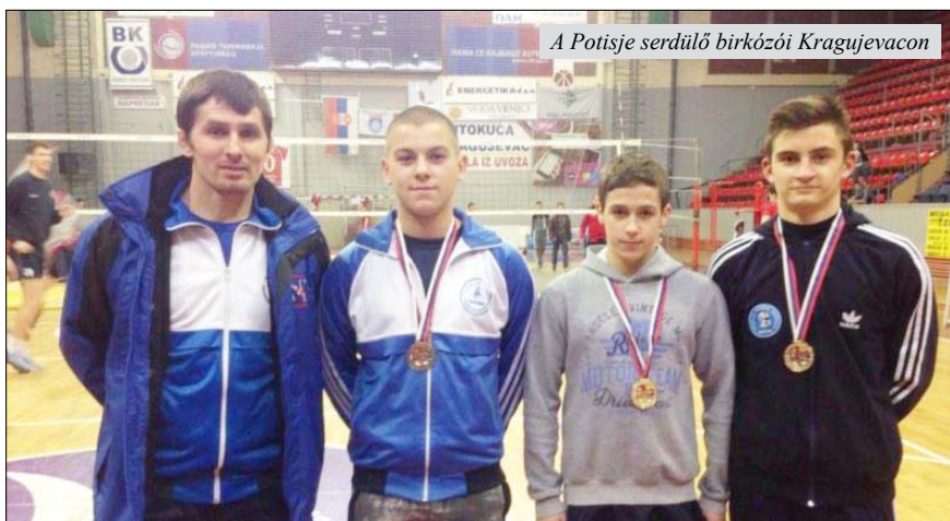
A Potisje serdülő birkózói Kragujevacon