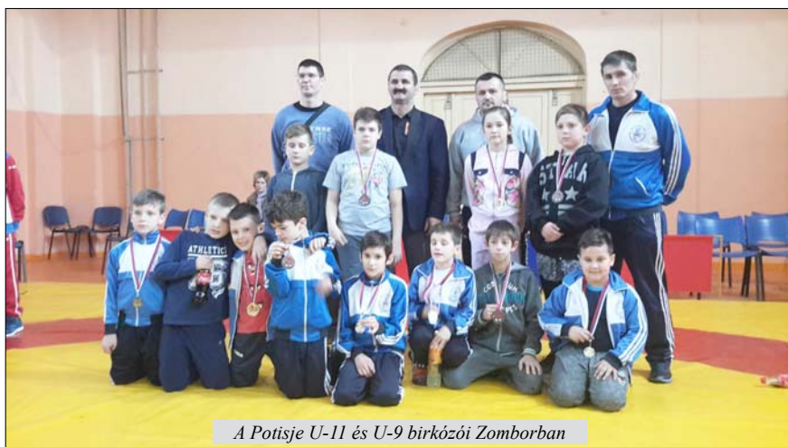
A Potisje U-11 és U-9 birkózói Zomborban

Eredmények: Zenta–Obilić 9:8 (3:2), Spartacus Vojput–Kanizsa 18:10 (9:4),