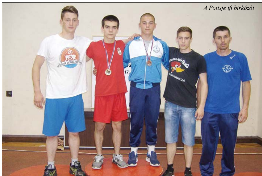
A Potisje ifi birkózói