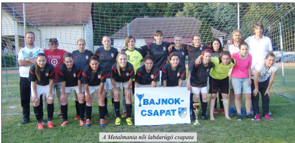
A Metalmania női labdarúgó csapata