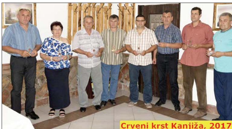
Crveni krst Kanjiža, 2017.