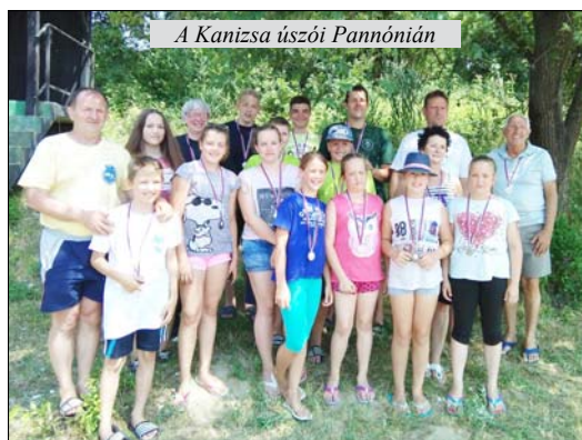
A Kanizsa úszói Pannónián

A korcsoportos verseny 3000 méteres távon zajlott le, a fiatalabb korosztály 200 méteres távon versenyzett. A magyarkanizsai úszóklub 18 versenyzővel képviselte magát, akik összesen 13 érmet szereztek.