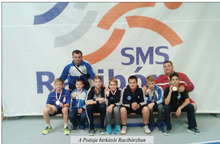
A Potisje birkózói Racibórzeban

A Belgrád melletti Ada Ciganlija evezőspályán rendezett ifjúsági kajak Euró-