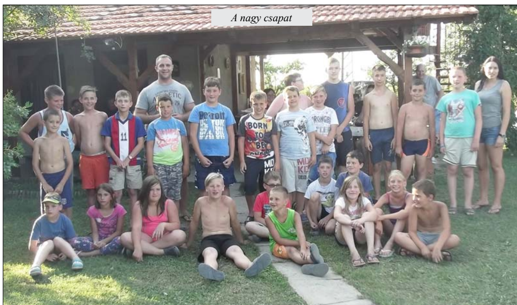
A nagy csapat