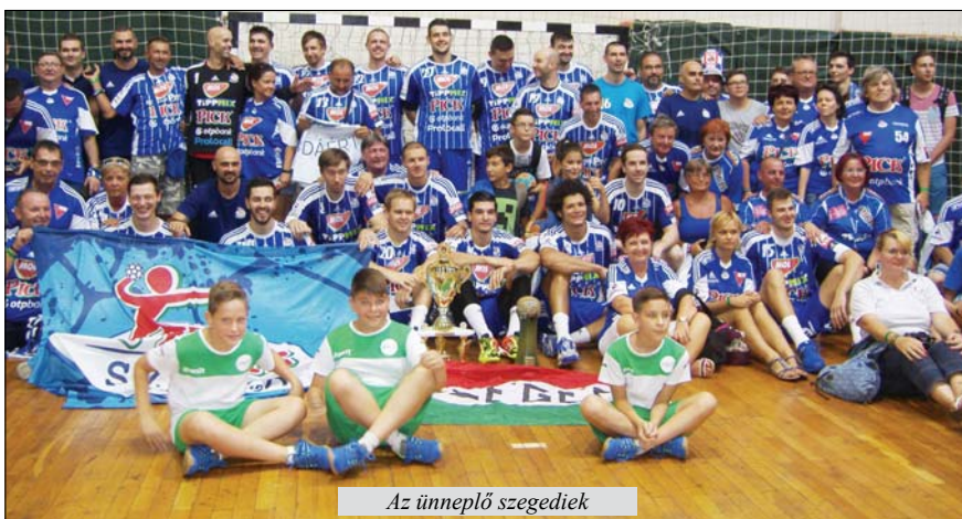
Az ünneplő szegediek

Az első félidőben a Partizan kezdett jobban, de a hajrában jobban összpontosító Bursa Nilüfer két gólos előnyt szerzett. A második félidőben váltakozva vezettek a csapatok és a rendes játékidőben döntetlen eredmény született. Ezután következtek a hétméteresek, amelyekben a Bursa Nilüfer volt eredményesebb és minimális 4:5 arányban győzött.