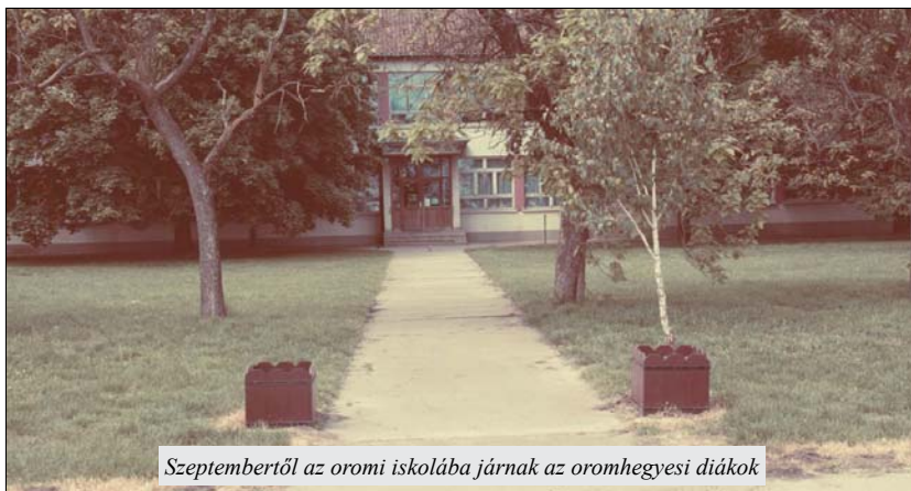
Szeptembertől az oromi iskolába járnak az oromhegyesi diákok