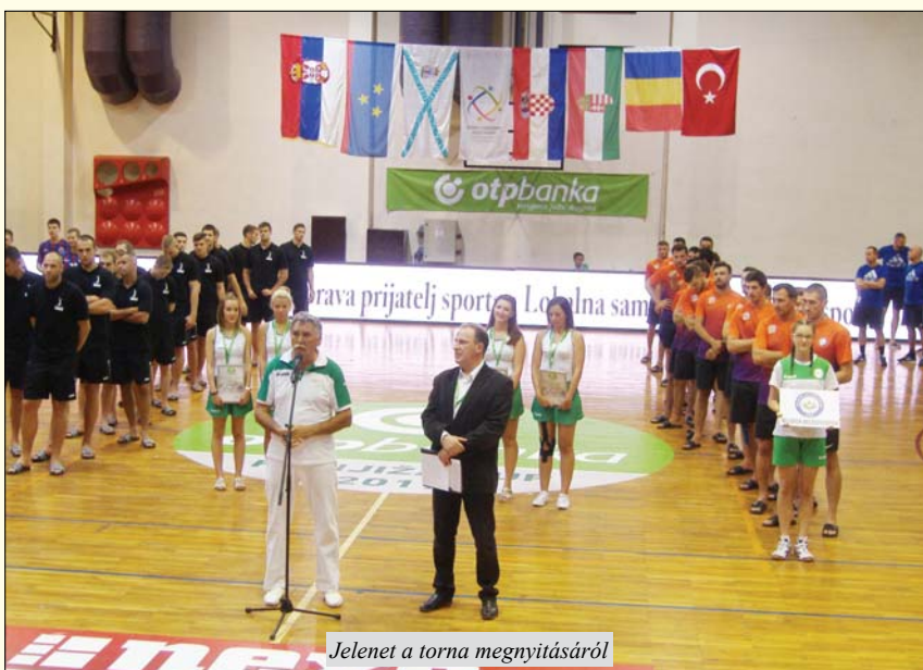
Jelenet a torna megnyitásáról