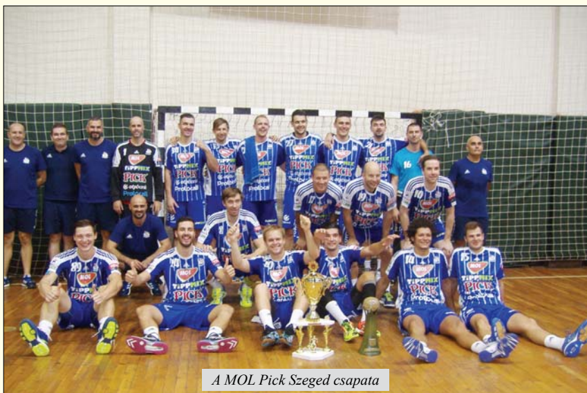
A MOL Pick Szeged csapata

A csoport: Nexe-Partizan 35:23 (16:11). A legeredményesebb góldobók: Marko Buvinić 9 illetve Nemanja Živković 5 góllal. A nyolcadik percig döntetlenre állt az eredmény, utána a Nexe került fölénybe és az első félidő öt gólos Nexe vezetéssel zárult. A második félidőben a Nexe még fokozta a tempót és végül nagyarányú győzelemmel szerezte meg a győzelmet