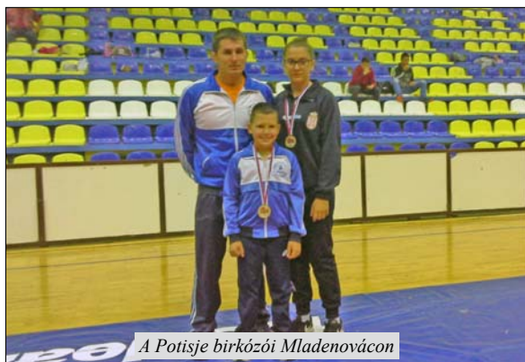
A Potisje birkózói Mladenovácon

A Mladenovácon rendezett gyerek korosztályú nemzetközi birkózó versenyen hat ország (Szerbia, Horvátország, Bosznia, Románia, Bulgária, Görögország) 27 klubjának 202 versenyzője lépett szőnyegre, köztük a magyarka-