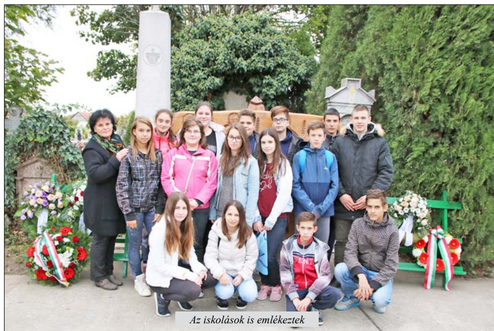
Az iskolások is emlékeztek