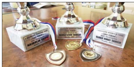
A 8. Csaba Ferenc nemzetközi birkózó emléktverseny érmei és serlegei

Részeredmények, 60 kg: D. Petrović-Kolompár 0:1 (pontozással), 67 kg: Losonc-Fríz 0:1 (tus), 72 kg: Sarnyai-Sremac 0:1 (tus), 77 kg: Vágó-Nemes M. 0:1 (tus), 82 kg: Lacković-F. Petrović 1:0 (pontozással), 87 kg: Slejher-Petrušić 1:0 (pontozással), 97 kg: Korom-Csábi 0:1 (feladás), 130 kg: Horváth 1:0 (küzdelem nélkül).