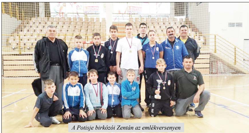
A Potisje birkózói Zentán az emlékversenyen