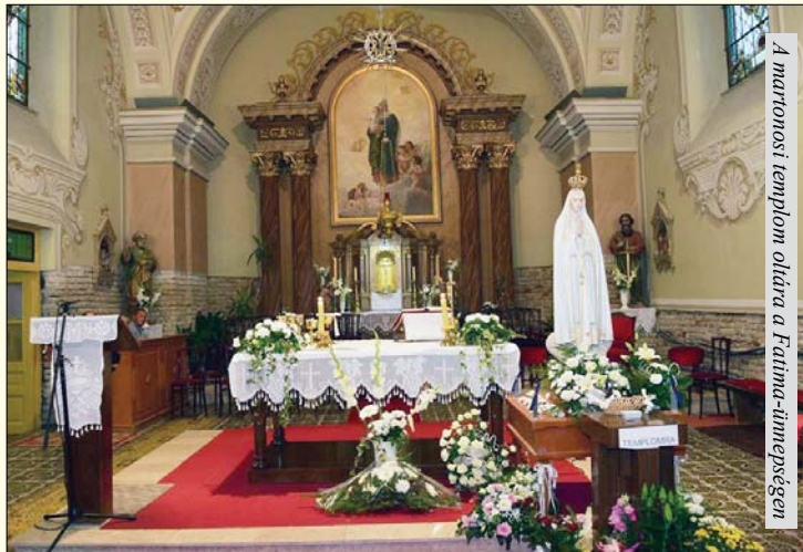
A martonosi templom oltára a Fatima-tímpeleken