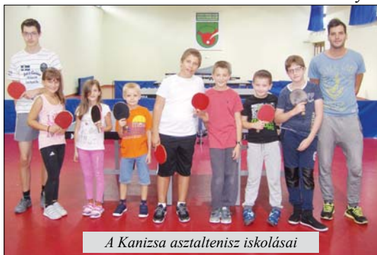
A Kanizsa asztalitenisz iskolásai

Vajdaság Asztalitenisz Szövetség szervezésében megalakultak a ligák a 2017/2018-as bajnoki idényre. A Kanizsa csapata a tizenegy tagú II. liga Északi csoportjában játszik, amelyben a Jedinstvo (Ópázova), Vojvodina (Újvidék), Egység (Újvidék), TSC (Topolya), Čelarevo (Dunacséb), Gusar (Sztapár), Zmajevó (Ókér), Roham (Magyarcsernye), Miletić (Militics) és Obilić–Aleva (Törökkanizsa) szerepel. A bajnokság őszi idénye november 4-én kezdődik, amikor az első fordulóban a Kanizsa csapata Újvidéken a Vojvodina ellen játszik.