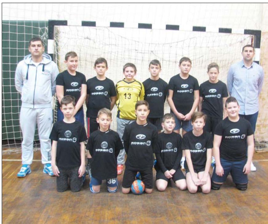
A Kanizsa fiú kézilabdacsapata