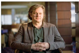
RÁTÓTI ZOLTÁN színművész