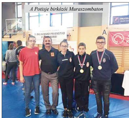
A Potisje birkózói Muraszombaton

Nagybecskerekén a Proleter Judoklub szervezésében rendezték meg az országos egyéni judobajnokságot a fiatalabb pionírok részére, amelyen 197 judós mérte össze tudását. Az idén az egyik legerősebb országos bajnokságnak lehettünk a szemtanúi, ahol minden súlycsoportban komoly küzdelmek voltak a dobogós helyezésekért.