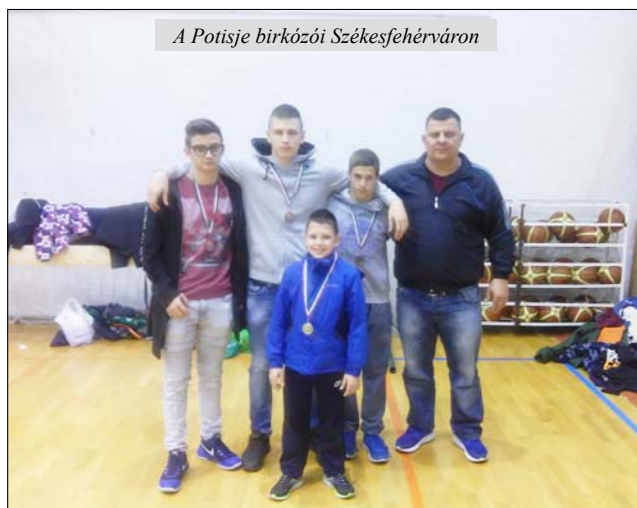
A Potisje birkózói Székesfehérváron