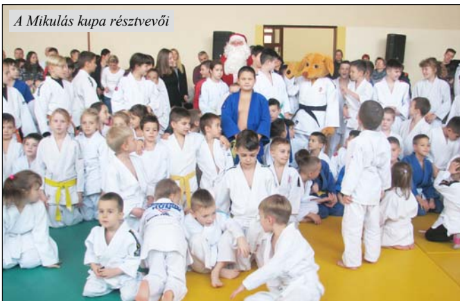
A Mikulás kupa résztvevői