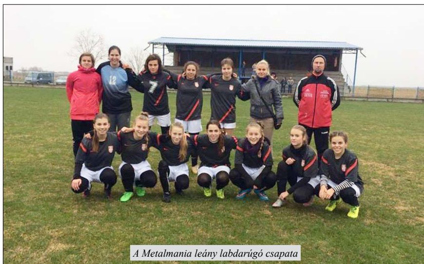
A Metalmania leány labdarúgó csapata

Eredmény, Óecska: Stajićevo-Metalmania 1:4