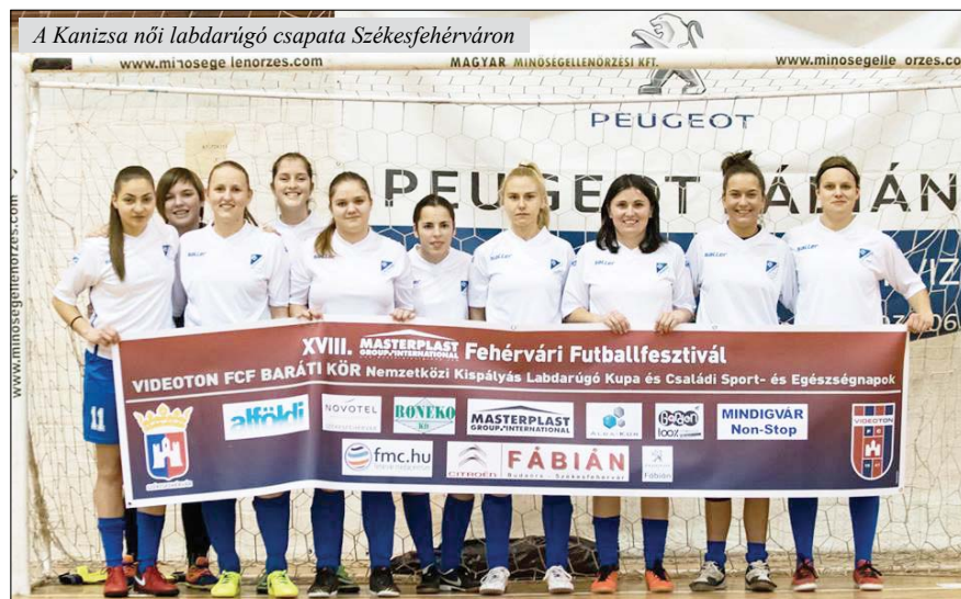
A Kanizsa női labdarúgó csapata Székesfehérváron

a második helyet szerezte meg, míg az utánpótlás csapat egy győzelemmel és két döntetlennel végzett csoportjában a második helyen, így a torna harmadik helyért játszottak. A harmadik helyért lejátszott mérkőzésen a Kanizsa felnőtt csapata 5:0 arányban győzte le a Kanizsa utánpótlás csapatát. A torna gólkirálya