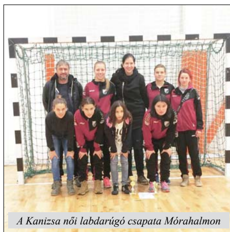
A Kanizsa női labdarúgó csapata Mórahalmon

A Mórahalmon rendezett 26. Luca kupa nemzetközi kispályás női labdarúgó-tornán a Kanizsa női labdarúgó klub két csapata vett részt. A Kanizsa felnőtt csapata csoportjában két győzelemmel és egy vereséggel csoportjában