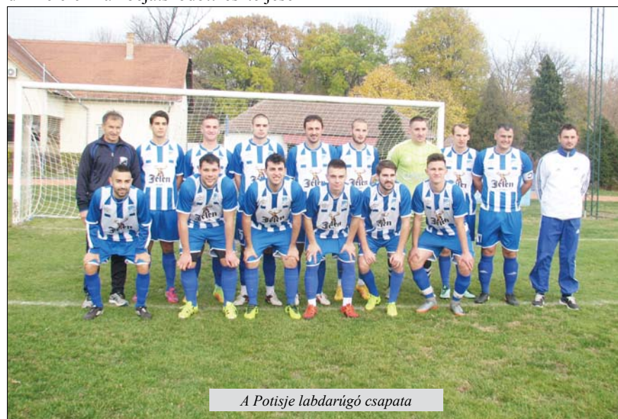
A Potisje labdarúgó csapata