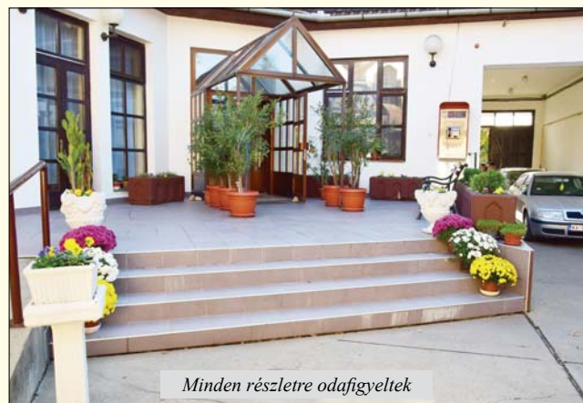
Minden részletre odafigyeltek