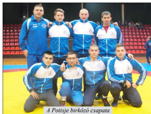
A Potisje birkózó csapata

– Habár 2017-ben nem sikerült megismételni a 2016-os eredményt és megvédeni a negyedik helyet az I. liga