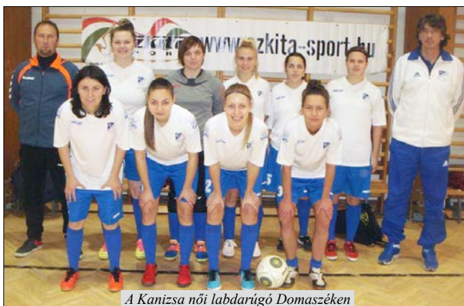
A Kanizsa női labdarúgó Domaszéken