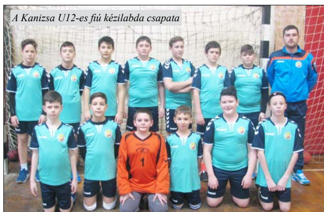
A Kanizsa U12-es fű kézilabda csapata