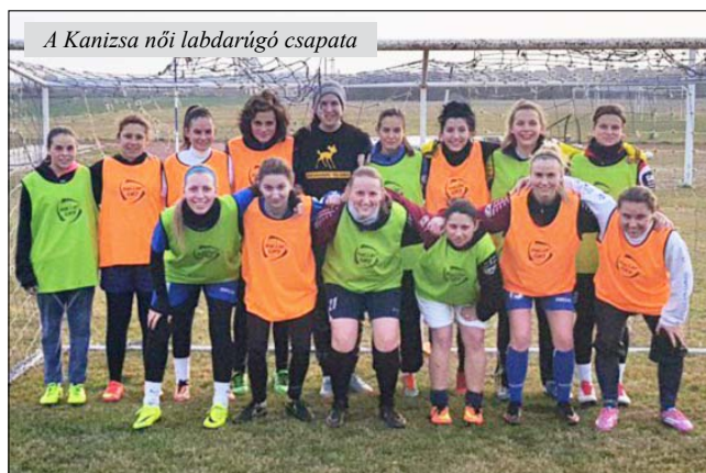
A Kanizsa női labdarúgó csapata