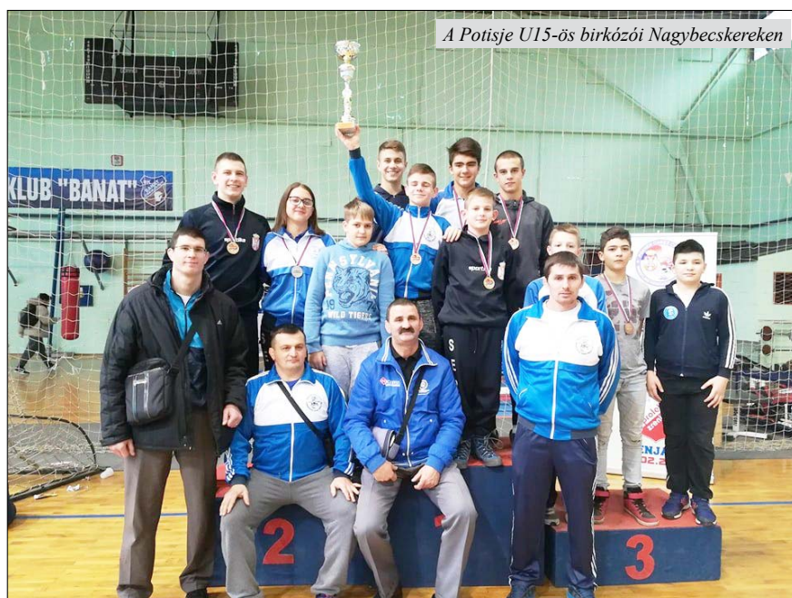
A Potisje U15-ös birkózói Nagybecskerekén

A csapatverseny élménye: 1. Potisje 140, 2. Soko (Zombor) 105, 3. Zenta 80 pont stb.