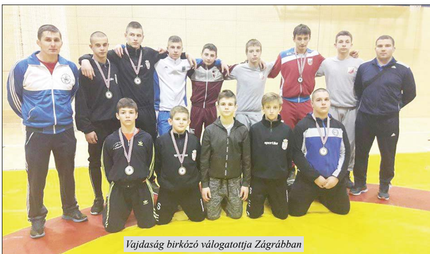
Vajdaság birkózó válogatottja Zágrábban

több tusgyőzelemmel Vajdaság válogatottja nyerte meg a mérkőzést.