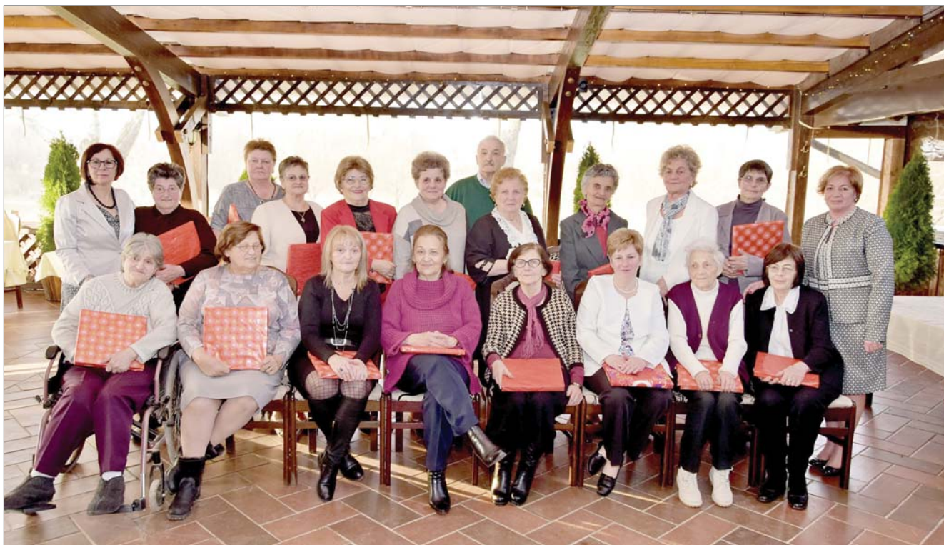
Nyugdíjas óvónők, akik minden nőnapkor együtt ünnepelnek.