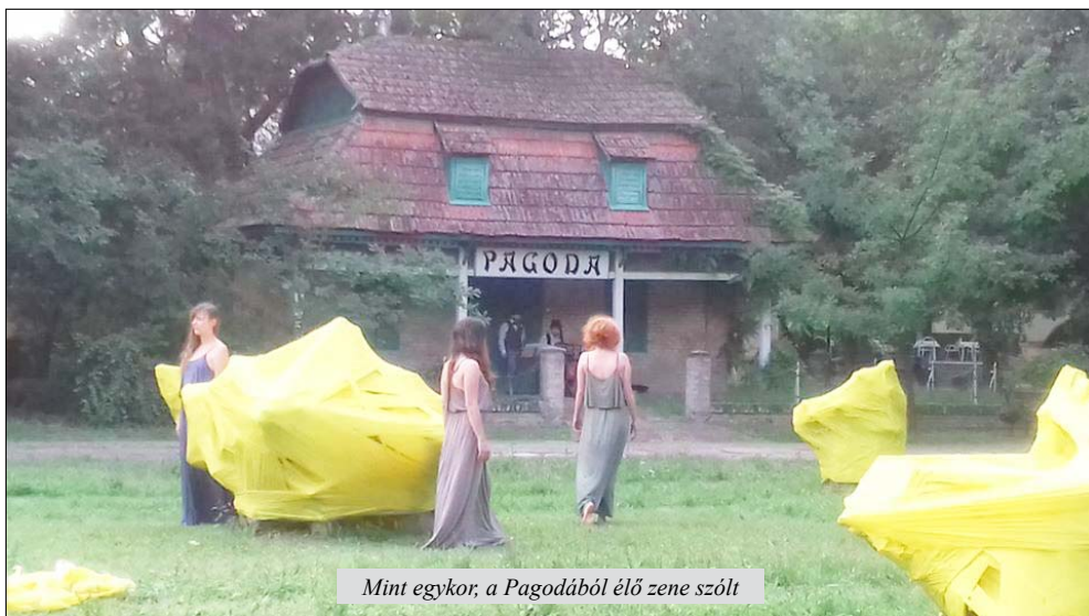
Mint egykor, a Pagodából élő zene szólt

A kültéri intervenciót csodálkozva, néhányan értetlenül, de szeretettel fogadták Magyarkanizsán, ami kortárs ruhába öltözve indította el az asszociációk sorát, és mi más is lehetne ettől nagyobb sikerélmény a művészek számára? Megidézték a kor hangulatát, sejtetve a letűnt idők szépségét, továbbadva és őrizve az emlékeket éltették a Népkertet.