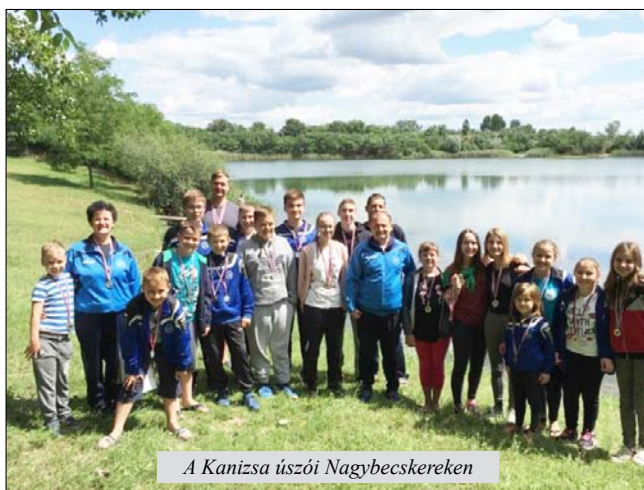
A Kanizsa úszói Nagybecskerekén