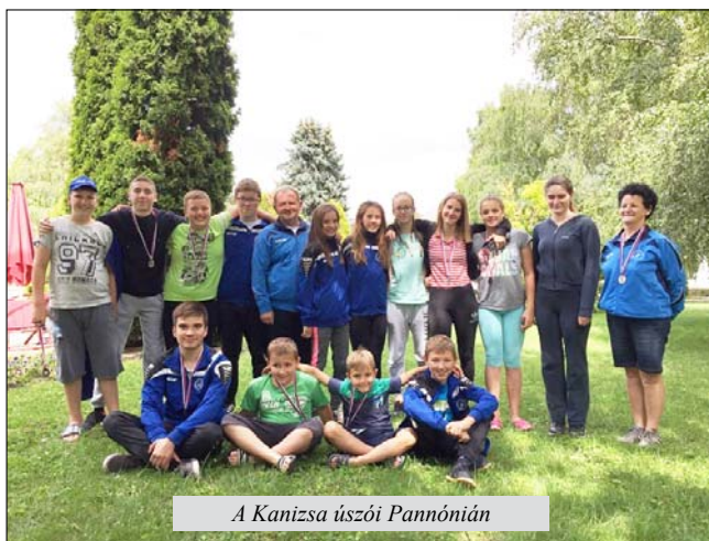
A Kanizsa úszói Pannónián