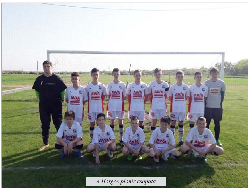
A Horgos pionir csapata

16 órától másnap 12 óráig folyamatosan Magyarokanizsai Körkép – Kanjiška panorama és Kávészünet – közéleti magazinműsor felváltva, egymás után