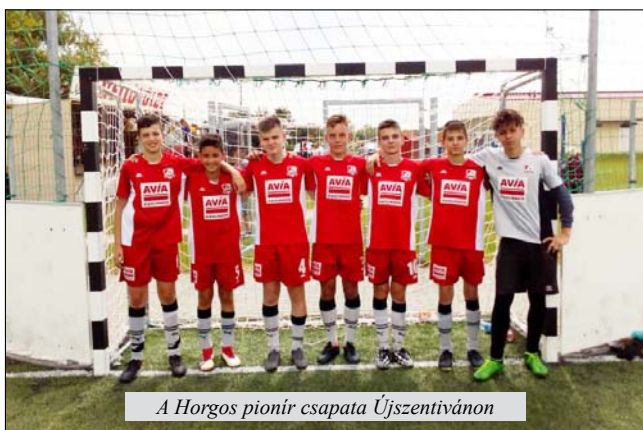
A Horgos pionír csapata Újszentivánon