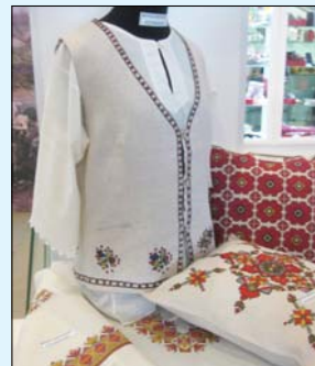
Koszovói szerb polgári hímzés a Belgrádi kiállításról 2018. 04. 19.