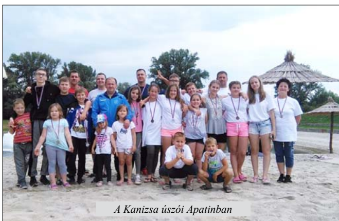
A Kanizsa úszói Apatinban