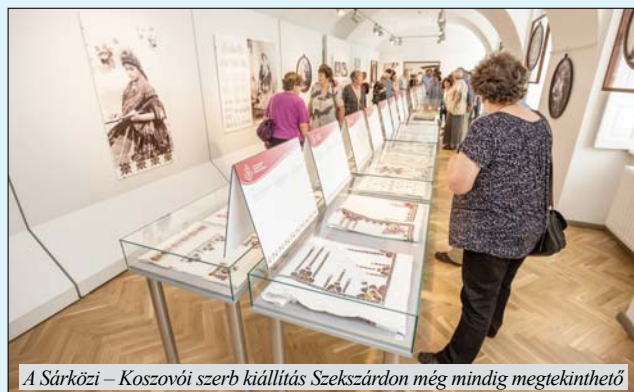
A Sárközi – Koszovói szerb kiállítás Szekszárdon még mindig megtekinthető