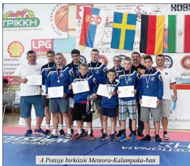
A Potisje birkózói Meteora-Kalampaka-ban