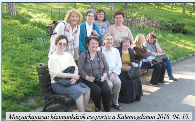
Magyarkanizsai kézimunkázók csoportja a Kalemegdanon 2018. 04. 19.