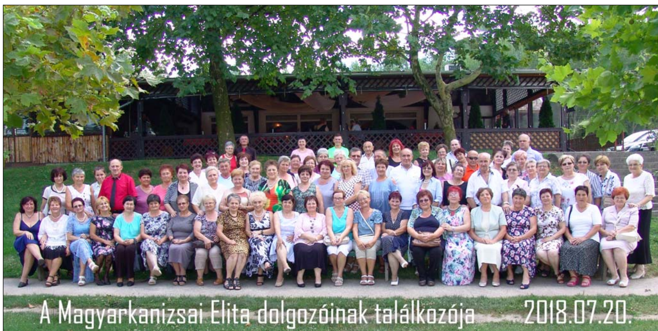
A Magyarakanizsai Elita dolgozóinak találkozója