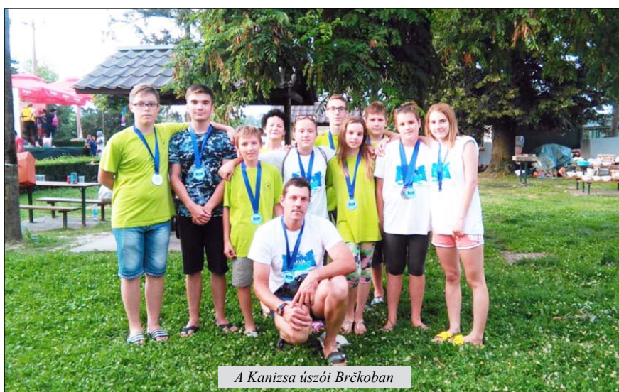
A Kanizsa úszói Brčkoban