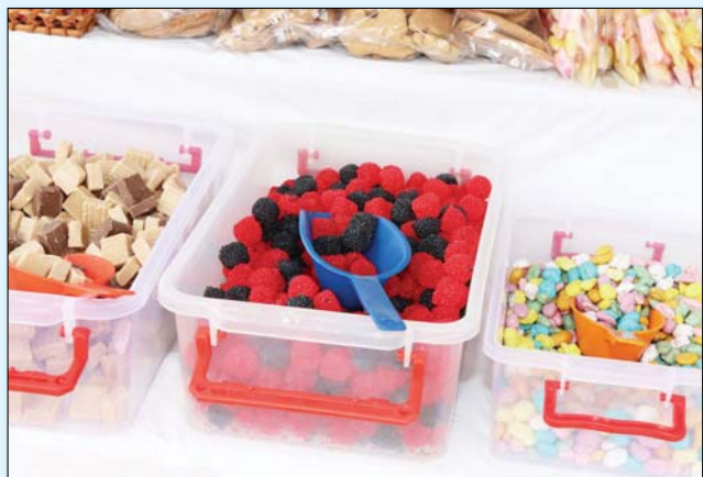
Puskás Károly felvételei a vasárnapi magyarkezisai vásárban készültek