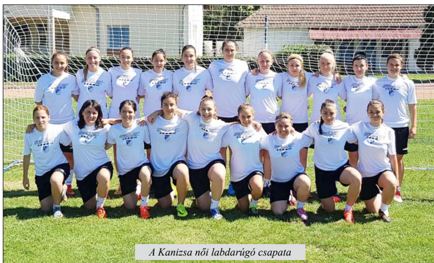
A Kanizsa női labdarúgó csapata