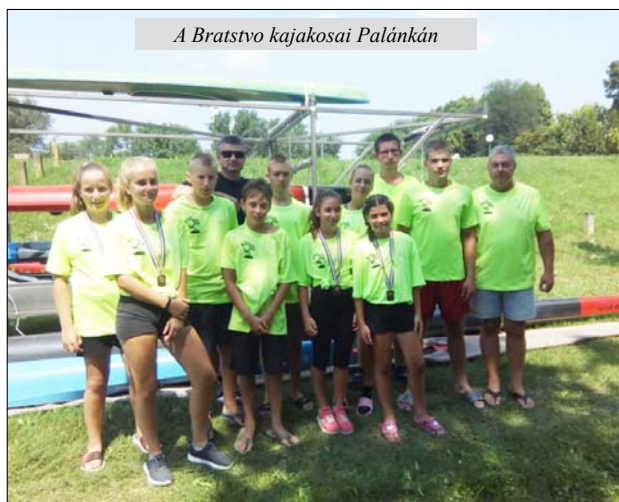
A Bratstvo kajakosai Palánkán