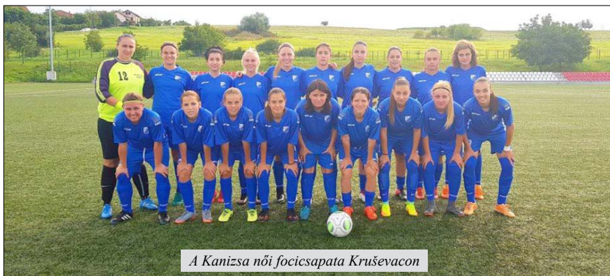
A Kanizsa női focicsapata Kruševacon

– A Potisje Labdarúgó klub elnökeként és edzőjeként az volt a legfontosabb feladatom, hogy játékosokat toborozzak és újra benevezzük a csapatot a Tisza menti liga bajnokságába. Elég nehéz volt nulláról indulni, mivel a klubnak nem volt egyetlen regisztrált játékosa sem, de sikerült egy tizennyolc fős játé-