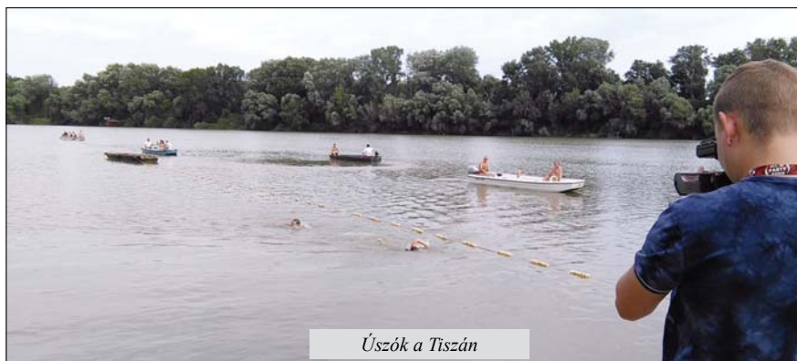
Úszók a Tiszán