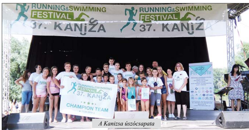
A Kanizsa úszócsapata