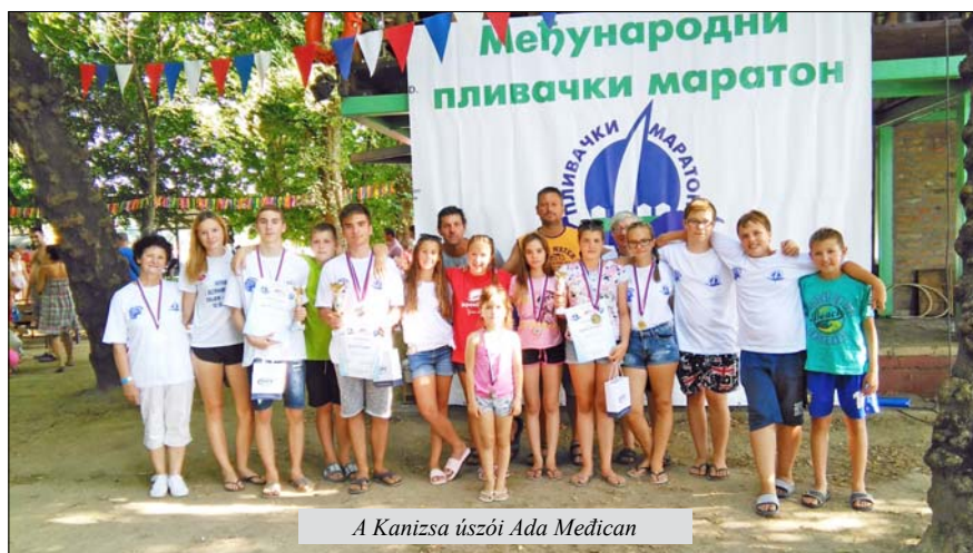
A Kanizsa úszói Ada Medican