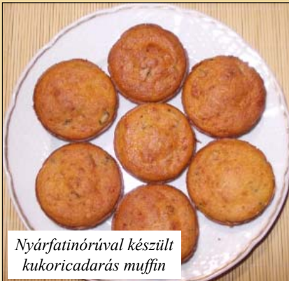
Nyárfatinórával készült kukoricadarás muffin