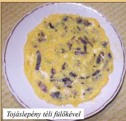
Tojáslepény téli fülökével