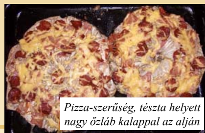
Pizza-szerűség, tészta helyett nagy özláb kalappal az alján