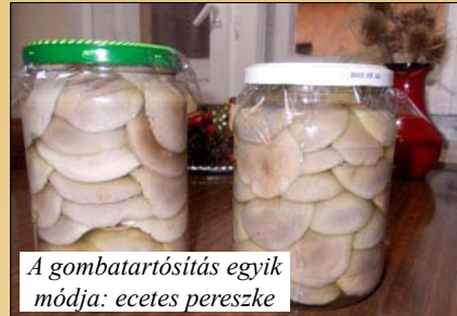
A gombatartósítás egyik módja: ecetes pereszke