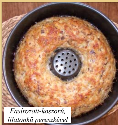
Fasírozott-koszorú, lilatönkű pereszkével