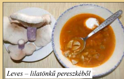
Leves – lilatönkű pereszkéből