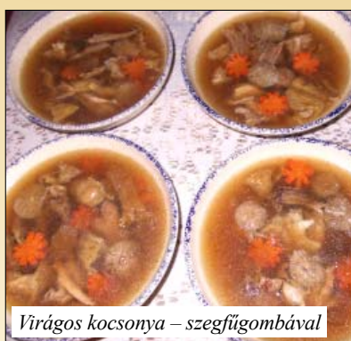
Virágos kocsonya – szegfűgombával