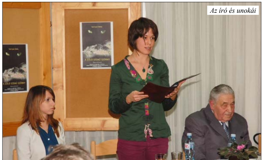
Az író és unokái