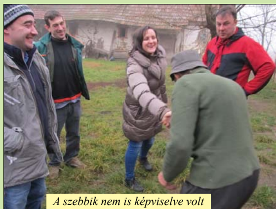
A szebbik nem is képviselve volt