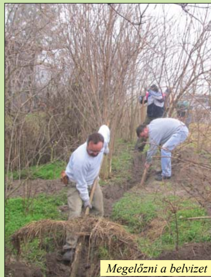
Megelőzni a belvizet

„Jaj pedig az egyedülállónak, ha elesik és nincsen aki őt felemelje” (Prédikátor könyve 4.)