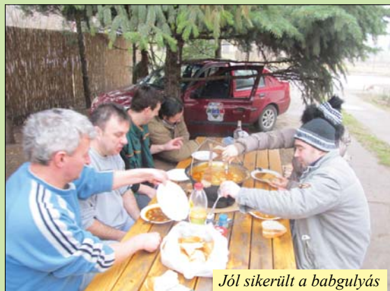
Jól sikerült a babgulyás